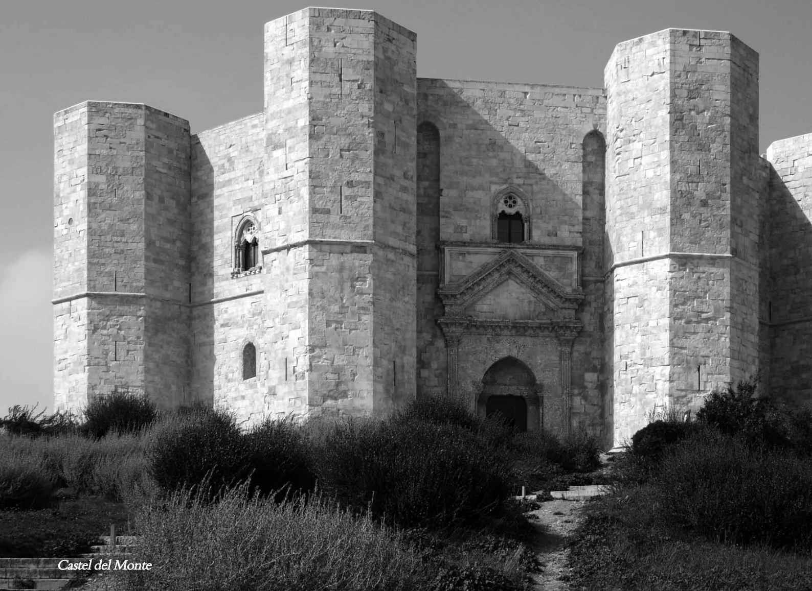
Castel del Monte