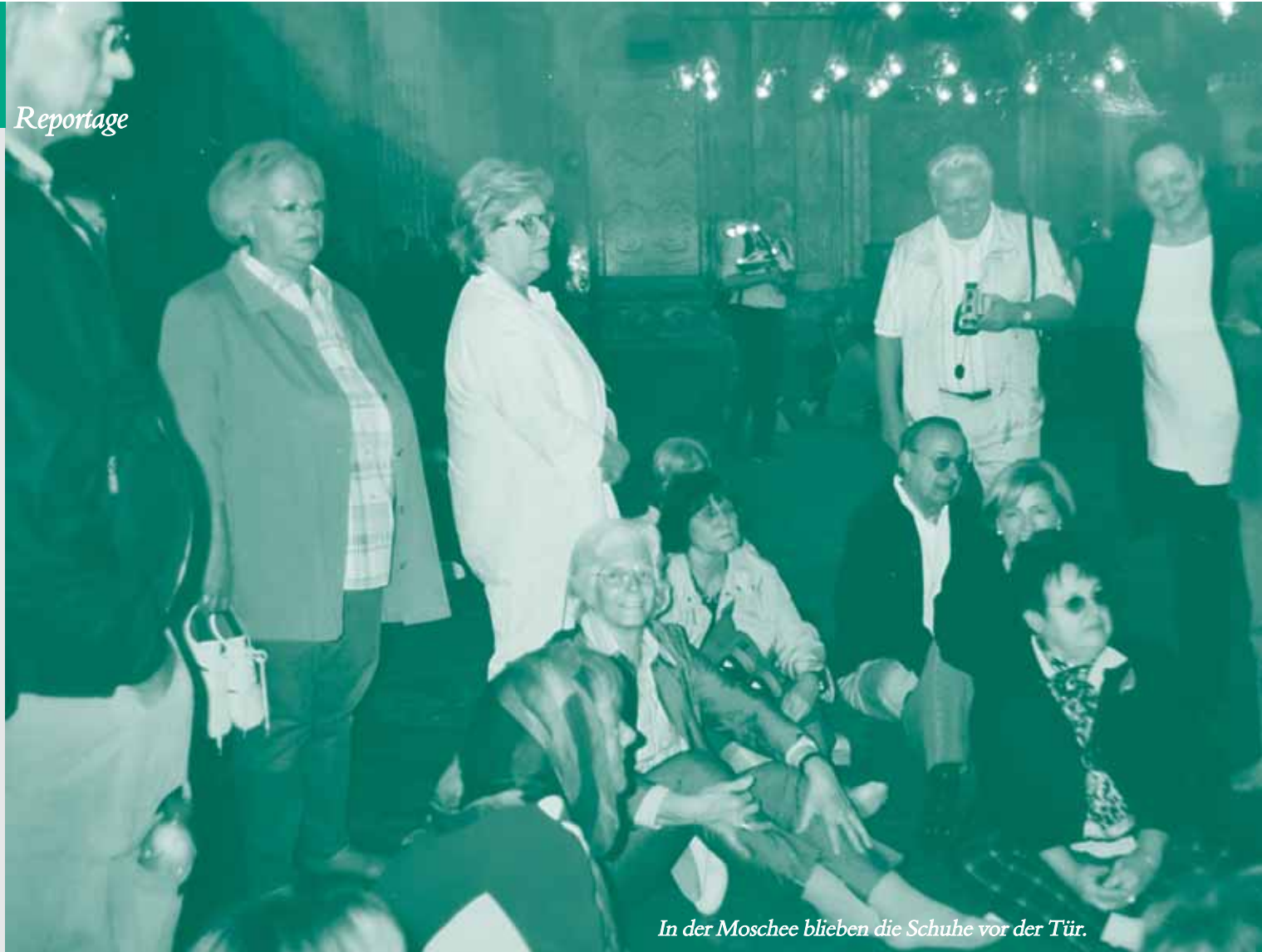
In der Moschee blieben die Schuhe vor der Tür.