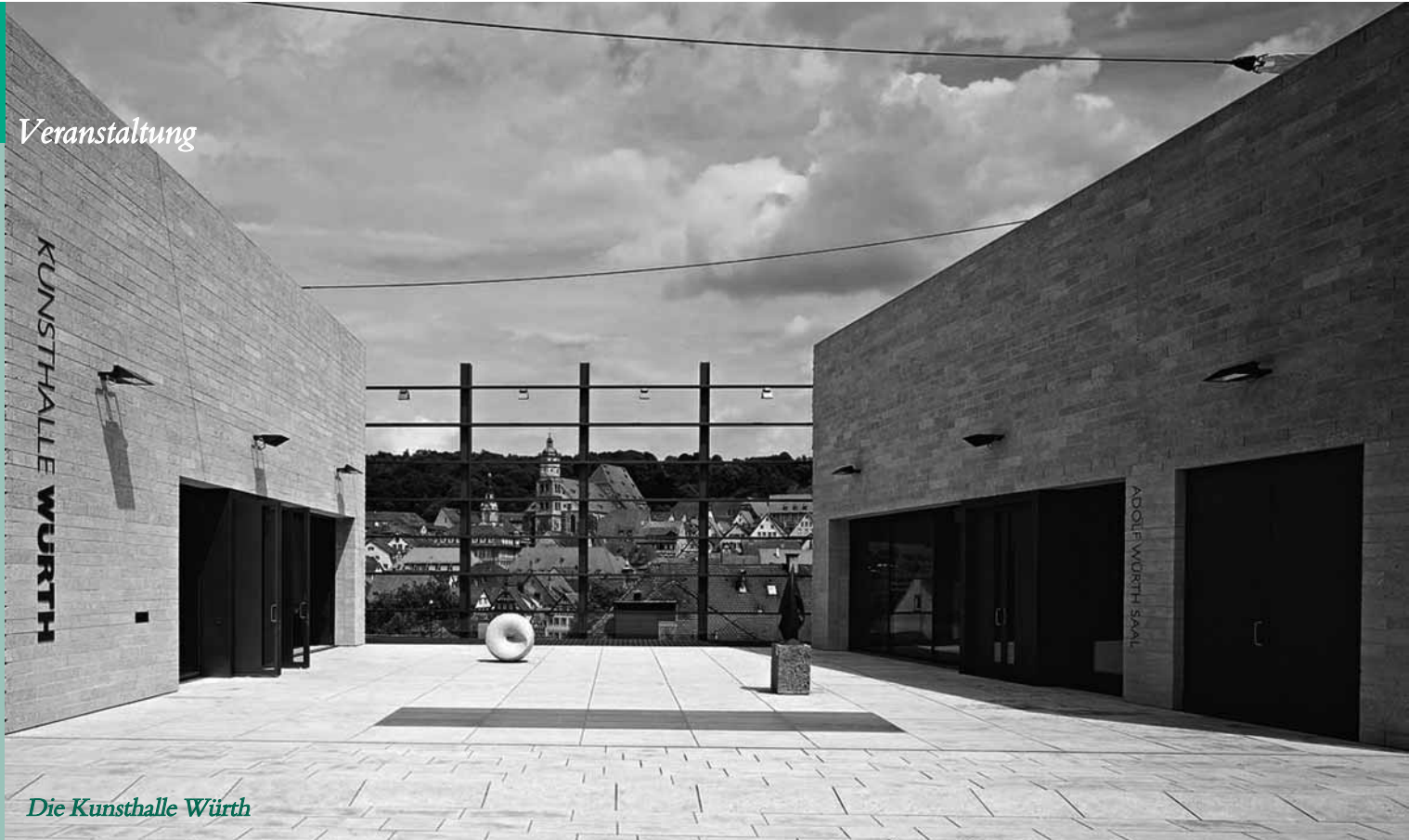
Die Kunsthalle Würth

Die Ausstellungsmacher sind selbstbewusst. „Lust auf mehr“ zeige alles: „das Spektakuläre, das Stille, das Arrivierte, das noch Aufstrebende“. Die Mitglieder des Kulturvereins können sich davon selbst ein Bild machen: Am 6. Februar 2020 führt ein Tagesausflug zur Kunsthalle Würth in Schwäbisch Hall, auf dem Rückweg steht die Besichtigung von Schloss Schillingsfürst auf dem Programm.