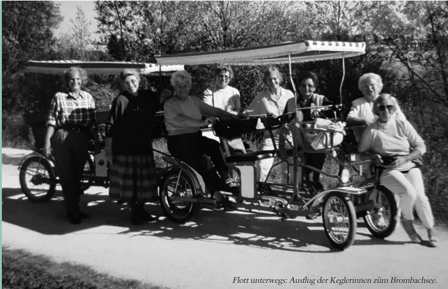
Flott unterwegs: Ausflug der Keglerinnen zum Brombachsee.

Morgen ging's. Beim Konzert der Wiener Sängerknaben am gleichen Vormittag war dann die Aufmerksamkeit, um es vornehm zu sagen, eingeschränkt. „Ich bin auch eingnickt“, gesteht die heute 86-Jährige. Sie bedauert nichts! Schon damals wusste sie, „so etwas erlebt man nimmer“.