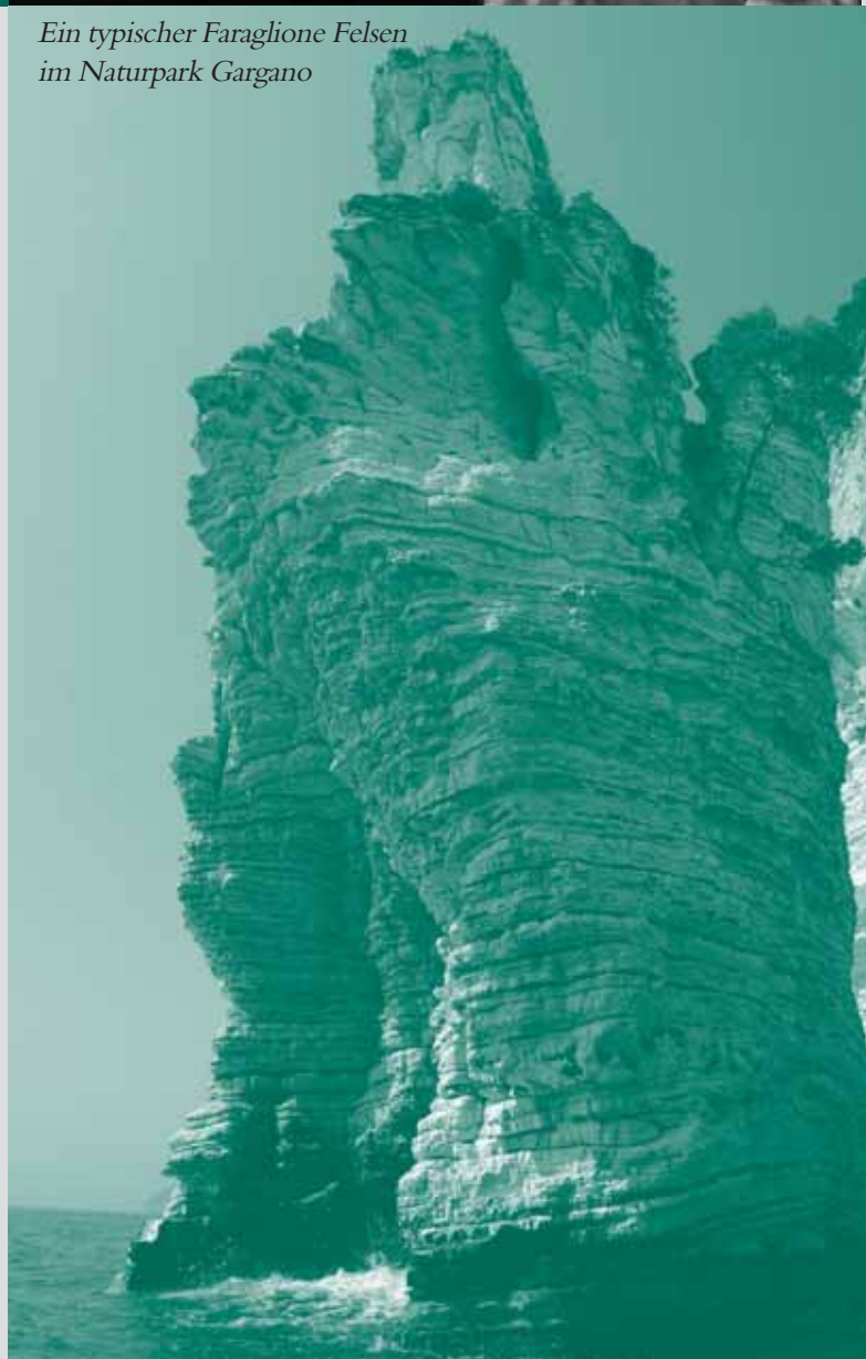
Ein typischer Faraglione Felsen im Naturpark Gargano