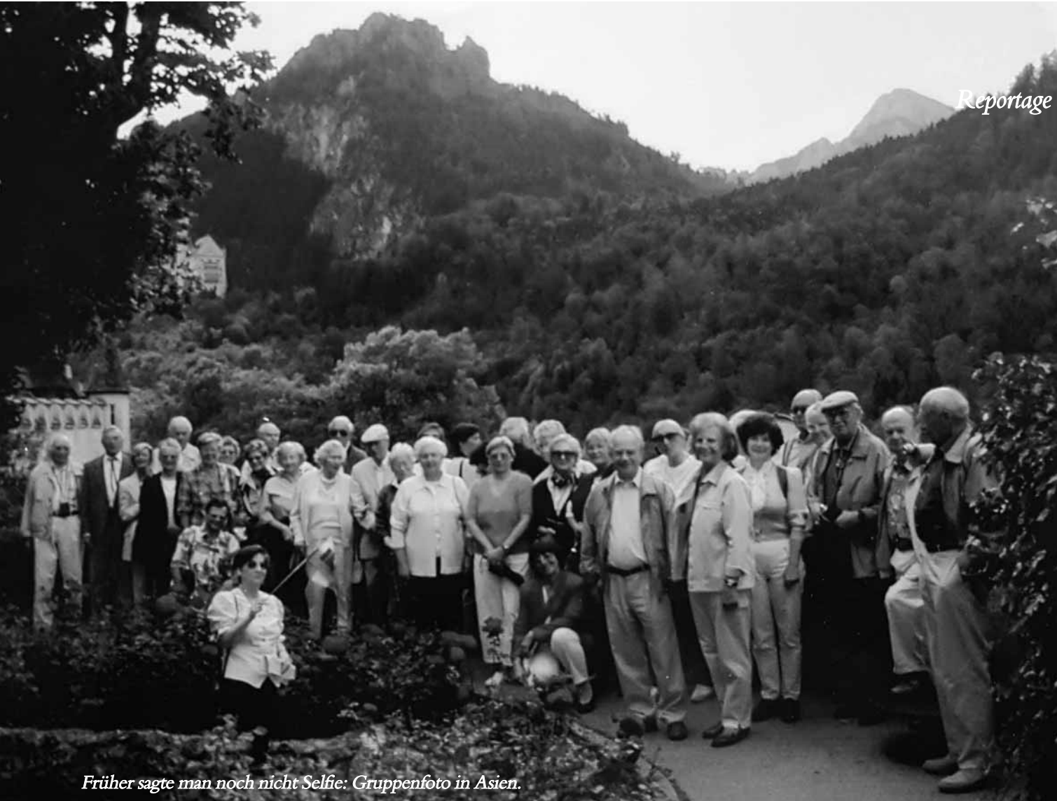
Früher sagte man noch nicht Selfie: Gruppenfoto in Asien.