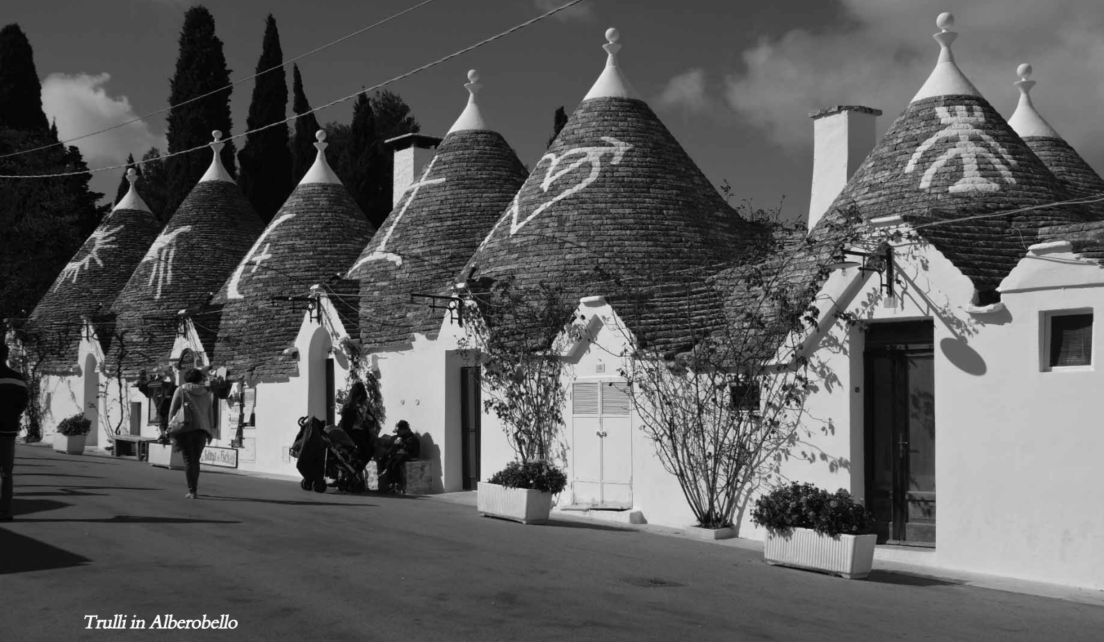
Trulli in Alberobello