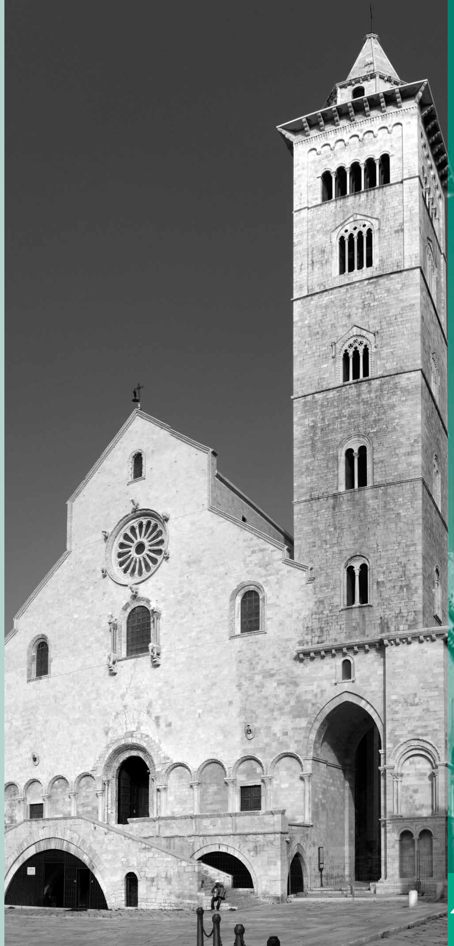
Die Kathedrale von Trani