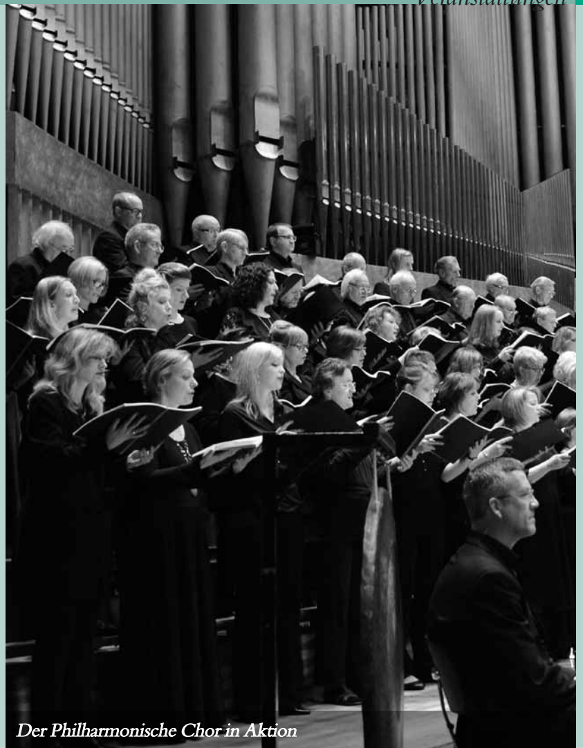
Der Philharmonische Chor in Aktion

Anmeldung und Reservierung im IKV-Büro unter 0911 / 53 33 16 oder ikv-nuernberg@t-online.de