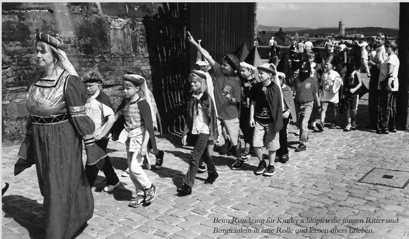
Beim Rundgang für Kinder schlüpfen die jungen Ritter und Burgfräulein in eine Rolle und lernen übers Erleben.