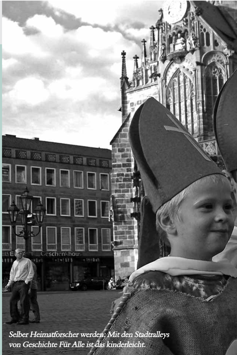
Selber Heimatforscher werden: Mit den Stadtralleys von Geschichte Für Alle ist das kinderleicht.

Kasperek: Ich denke, das wird auf uns verstärkt zukommen. Wir haben auch schon einstündige Rundgänge entwickelt. Der Nachteil ist, dass jeder einzelne keine so große Themenvielfalt mehr bieten kann. Heute früh hatte ein Demenzzrundgang Premiere, den wir für Betroffene und ihre Angehörigen entwickelt haben. Die Hesperidengärten bilden hierbei den geschützten Rahmen, in dem man sehen, fühlen und schmecken kann, und sie lassen genügend Raum für Reaktionen – es kann sich bei einem solchen Rundgang auch alles anders entwickeln als geplant.