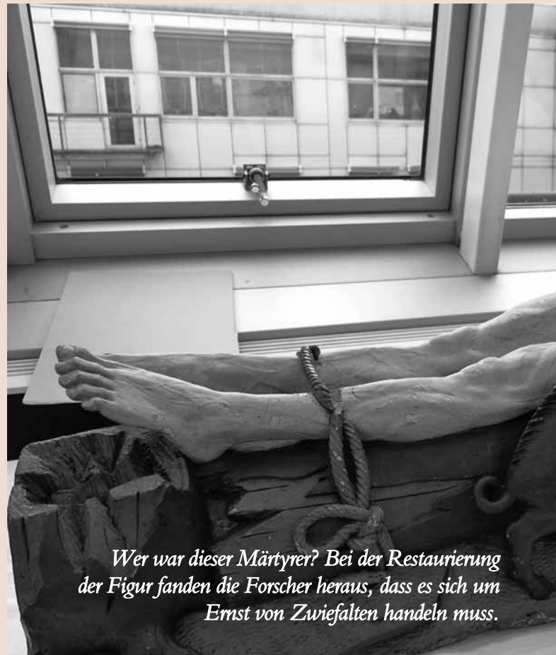
Wer war dieser Märtyrer? Bei der Restaurierung der Figur fanden die Forscher heraus, dass es sich um Ernst von Zwiefalten handeln muss.

Dagegen haben es Mediziner leicht. „Sie müssen nur den Körper mit Haut und Knochen röntgen, wir dagegen haben an einem Tag einen Mörser aus Bronze und am nächsten ein Blatt Papier, bei dem wir das Wasserzeichen suchen“, sagt Oliver Mack. Und wenn das Röntgen nicht reicht, können die Kunsttechnologien auch ein mobiles hochauflösendes Infrarotaufnahmesystem oder die UV-Fluoreszenzphotografie anwenden.