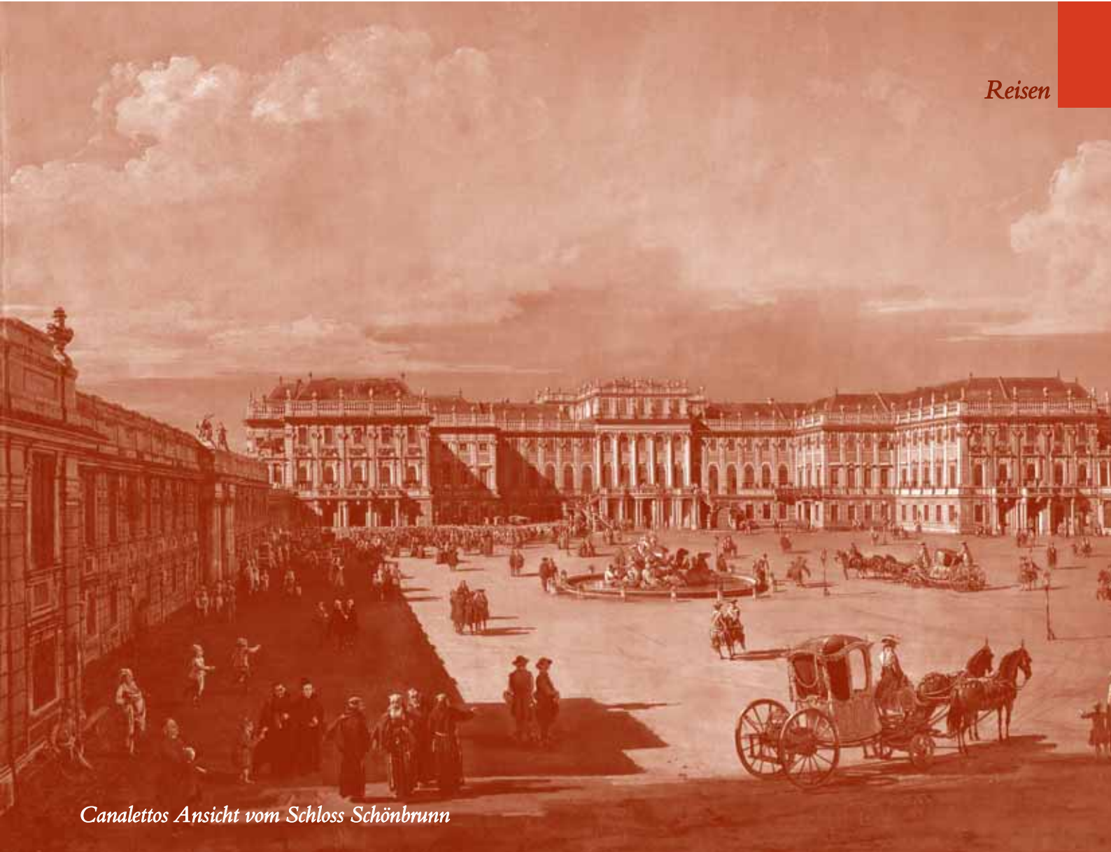
Canalettos Ansicht vom Schloss Schönbrunn