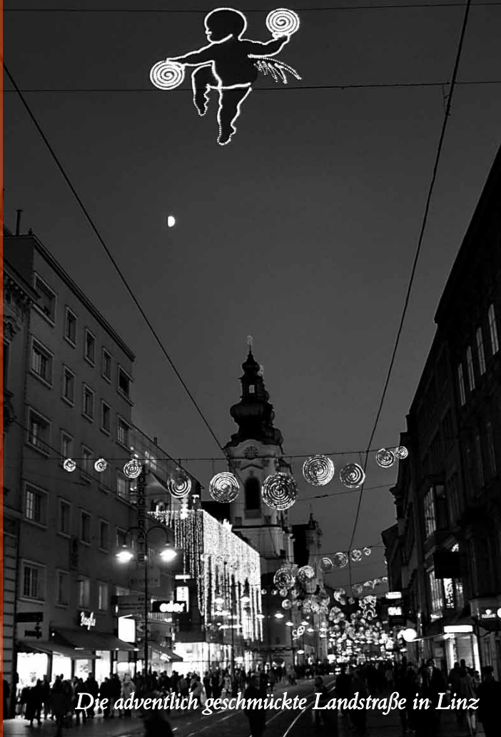
Die adventlich geschmückte Landstraße in Linz