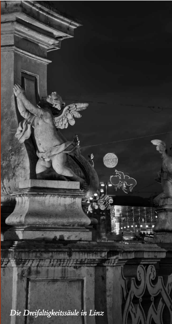
Die Dreifaltigkeitssäule in Linz