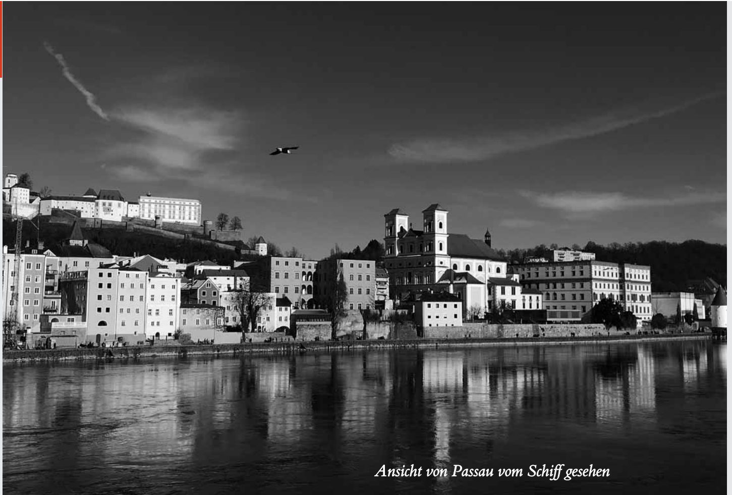
Ansicht von Passau vom Schiff gesehen