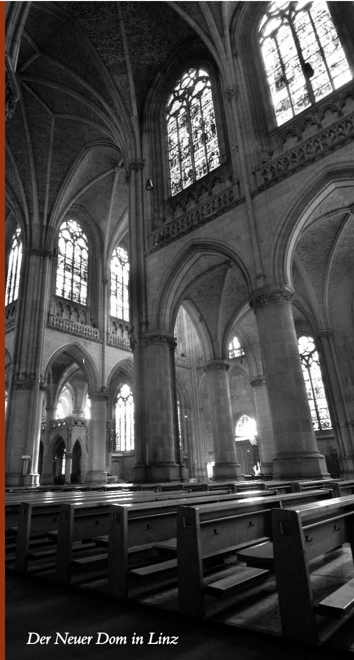
Der Neuer Dom in Linz