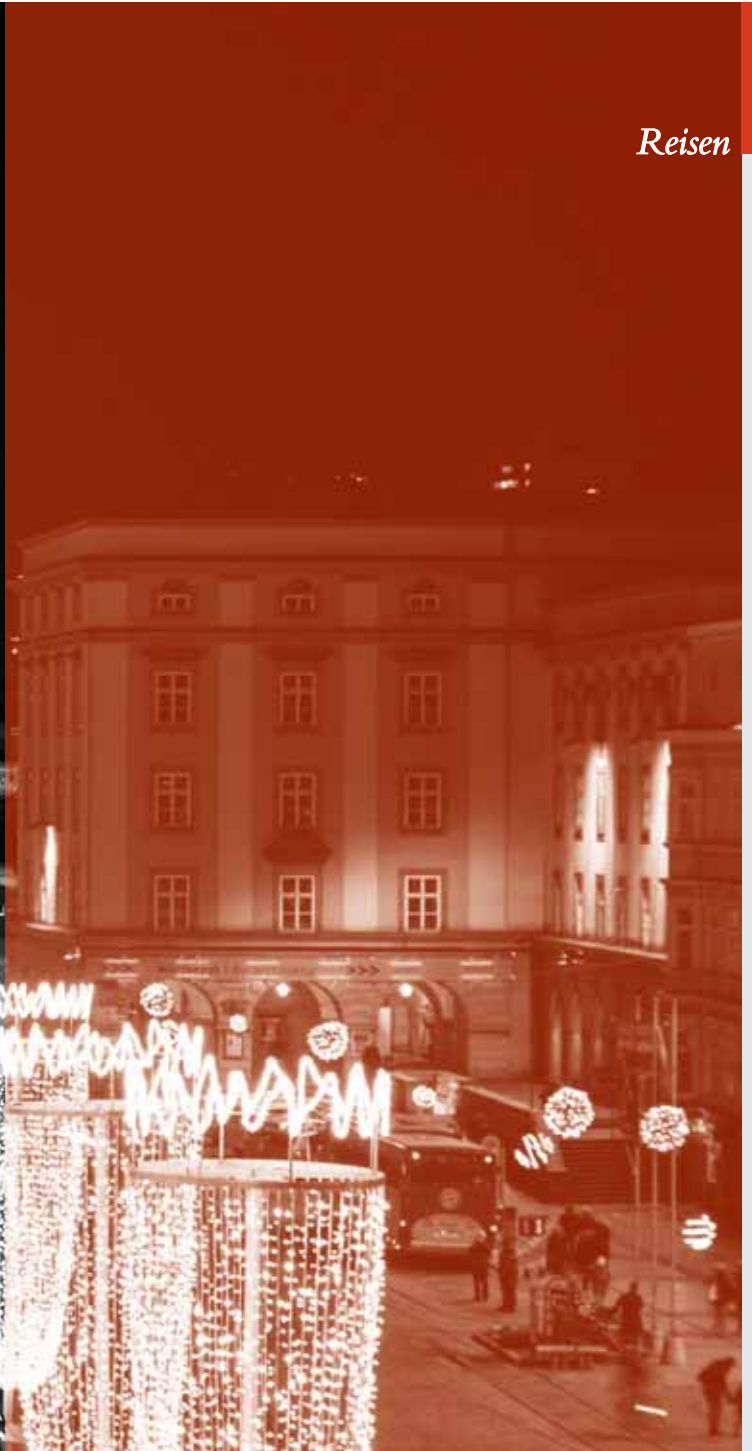
Weihnachtsmarkt auf dem Hauptplatz in Linz

Zum gebuchten Top-Tarif „Premium alles inklusive“ gehören ein umfangreiches Frühstücks- Mittag- und Dinner-Buffet sowie auch die Getränke. Für alle Gäste sind die großzügigen, modern gestalteten Gemeinschaftsbereiche des Marktrestaurants und der Salon zugänglich. Außerdem befinden sich eine finnische Panorama-Sauna und eine Bio-Sauna an Bord, die wie der Fitness-Bereich auch, kostenfrei genutzt werden können.