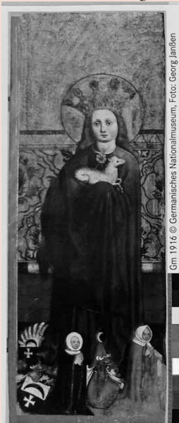
Gm 1916

So gesehen ist die neue Technik ein Segen für die historische Forschung, das meint auch Oliver Mack. Der internationale Austausch über Kunstwerke kann Wissenslücken schließen und wird sicher noch die eine und andere Überraschung zutage bringen. Wir dürfen gespannt sein.