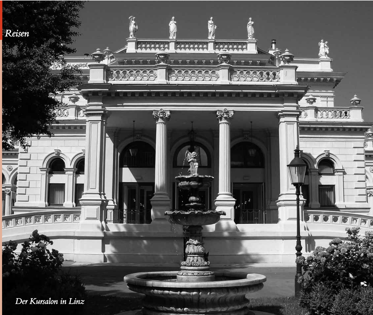
Der Kursalon in Linz