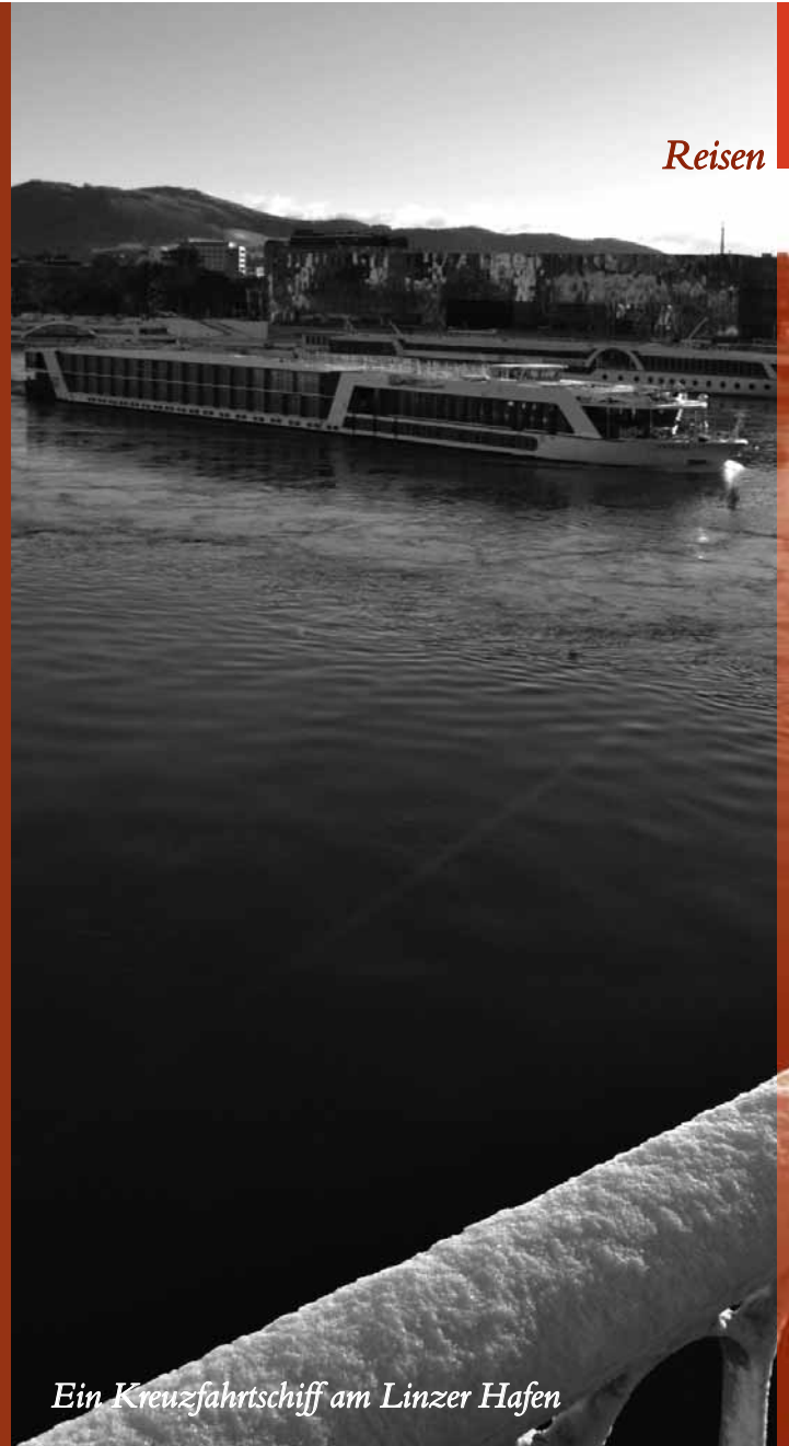
Ein Kreuzfahrtschiff am Linzer Hafen

Das Alte Rathaus stammt in seiner heutigen Form aus dem 16. Jahrhundert und weist, wie viele Häuser in Linz, einen Arkadenhof auf. Das Feichtinger-Haus, ein repräsentatives Palais, war ehemals eine Buchdruckerei. Beim Rundgang entdecken die Reisenden außerdem das Landhaus im Renaissancestil sowie das Linzer Mozarthaus und den Alten Dom, der Wirkungsstätte des berühmten Komponisten Anton Bruckner war. Bruckner war von 1856 bis 1868 hier Domorganist und ließ die Orgel nach seinen Vorstellungen umgestalten. Als Linzer Brucknerorgel genießt sie inzwischen einen Ruf als herausragende Denkmalorgel.