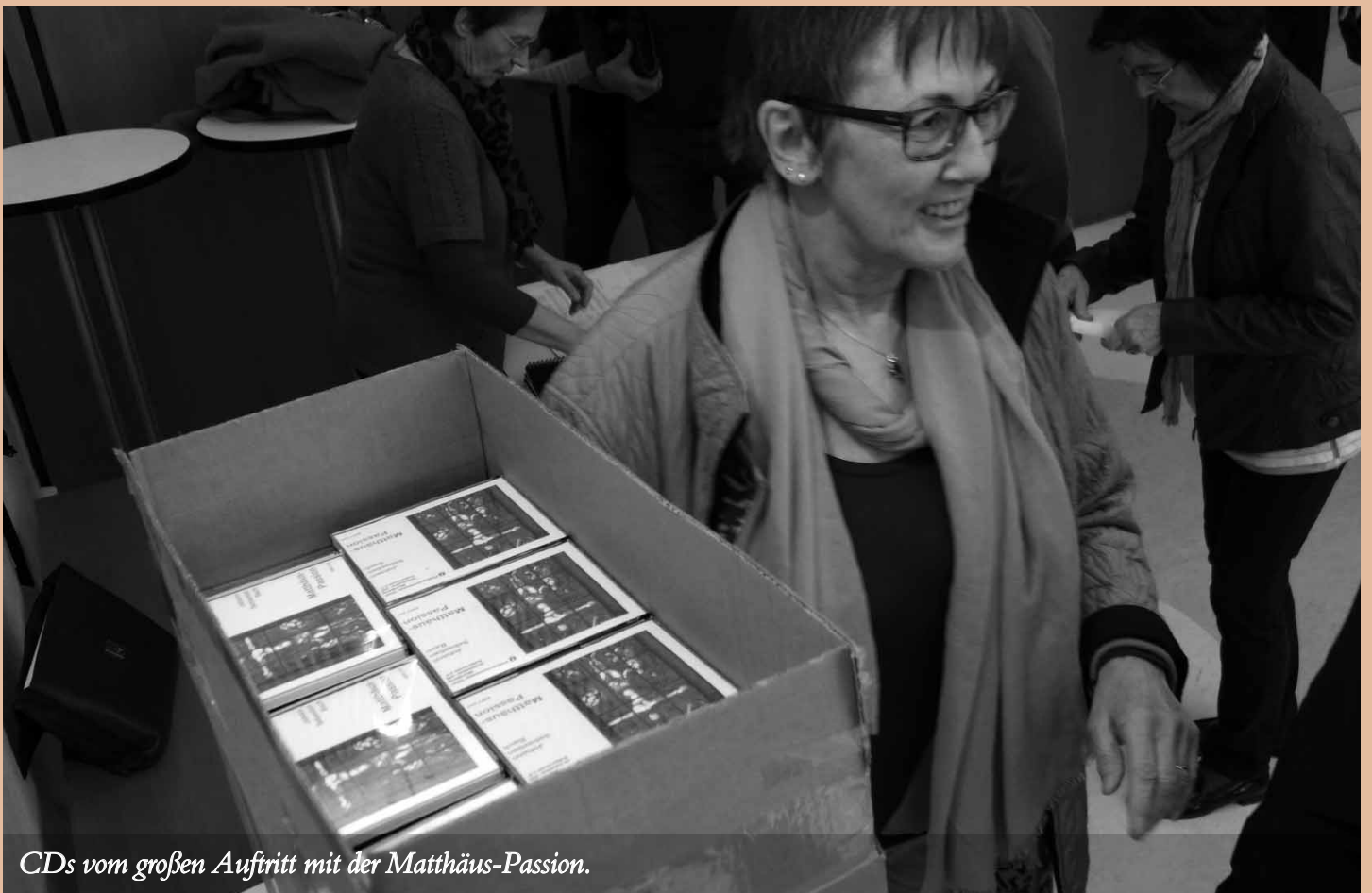
CDs vom großen Auftritt mit der Matthäus-Passion.