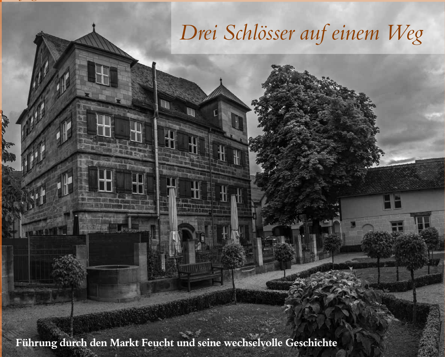
Führung durch den Markt Feucht und seine wechselvolle Geschichte

Z eidlerschloss, Pfinzingschloss und Tucher- schloss – die Feuchter dürfen sich reich fühlen. Reich an Geschichte und reich an architektonischen Attraktionen. Warum die Patrizier ihrem Reichtum so gern vor den Toren der Noris frönten? Man weiß es nicht, kann aber ahnen, dass auch im 15. Jahrhundert schon die Enge der Stadt so manchem auf die Nerven ging. Eine Stadtführung in Feucht am 16. Juli 2015 klärt auf.