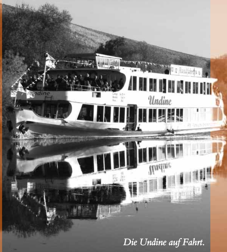
Die Undine auf Fahrt.

Schiffahrt, Panoramabahn und Wanderung durch die Weinberge am 24. September