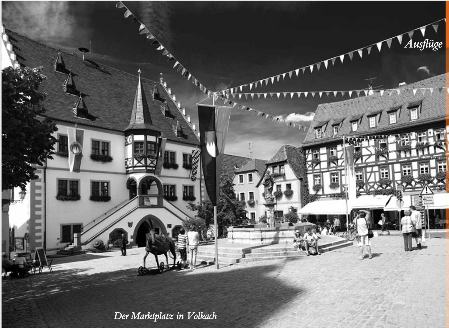
Der Marktplatz in Volkach

Dieser Tag ist wie gemacht für alle, die Wein lieben – und die gut zu Fuß sind. Denn die Wanderung dauert, auch wenn sie nicht zu anspruchsvoll ist, doch 2,5 Stunden. Gutes Schuhwerk ist wichtig, ein Rucksack mit Wasserflasche und Regenschutz sinnvoll.