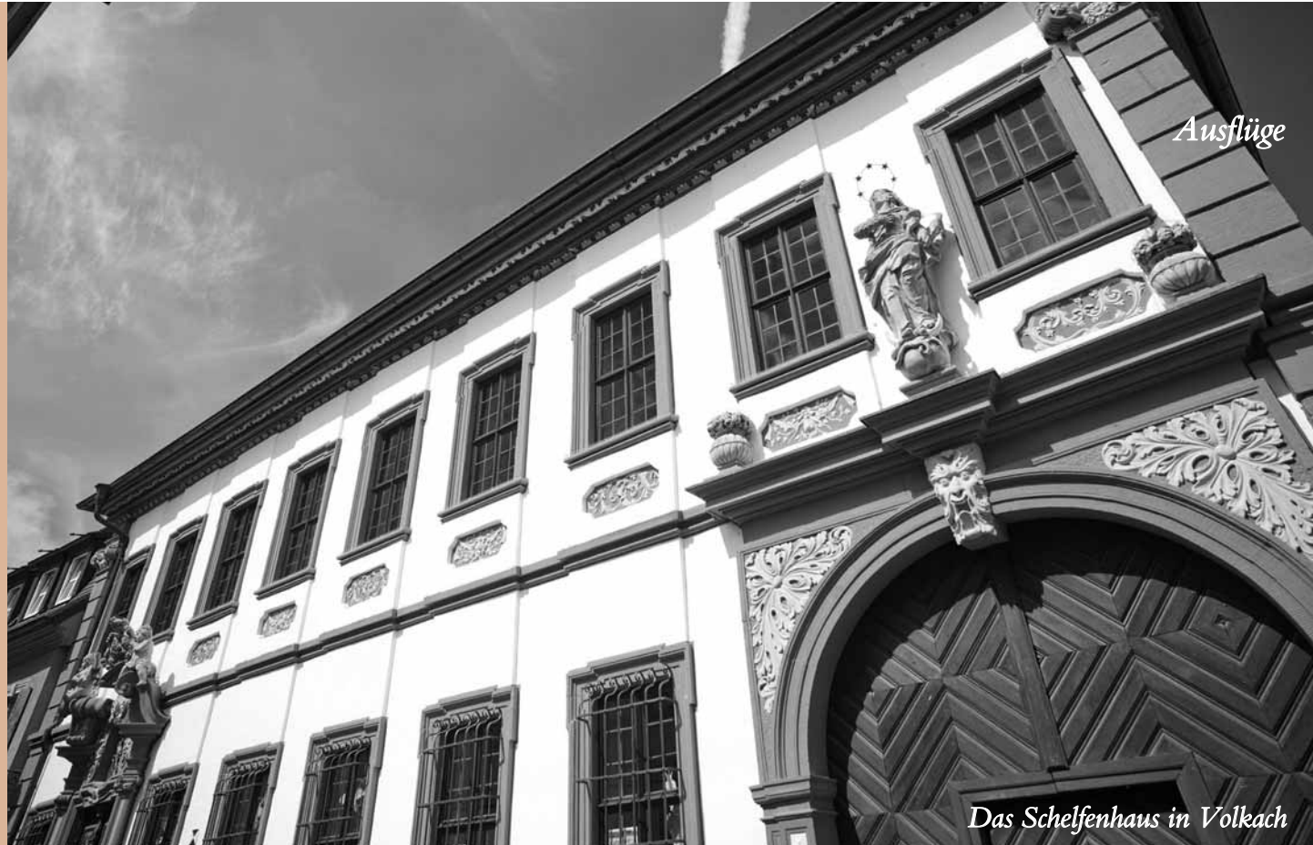
Das Schelfenhaus in Volkach

Großartige Blicke auf die Mainschleife und die Rebhänge belohnen die Mühen der Wanderer, die gegen Abend wieder beim Weingut eintreffen. Dort wird ein so köstliches wie kräftiges 3-Gänge-Menü aufgetischt, begleitet von den passenden Weinen.