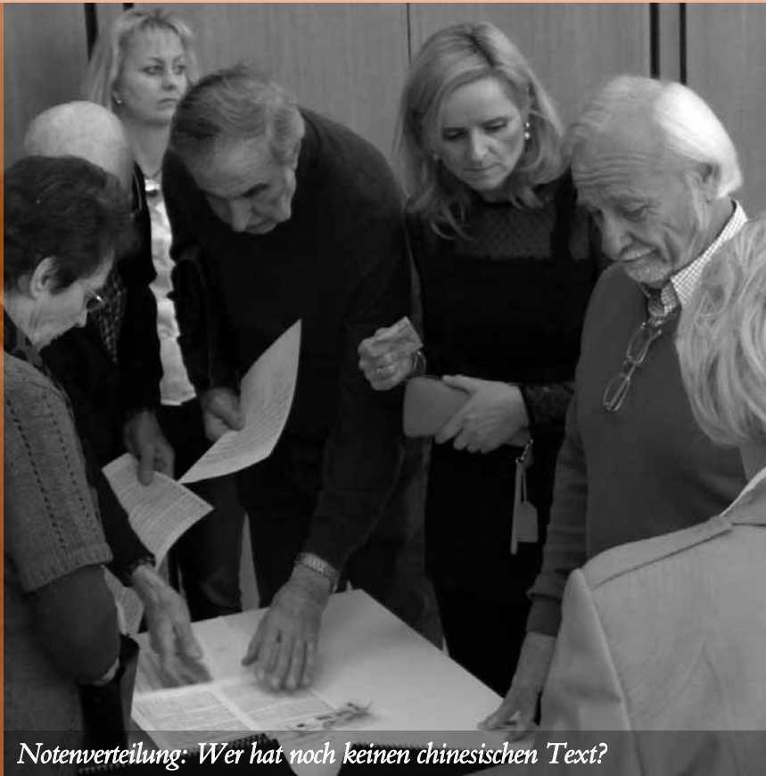
Notenverteilung: Wer hat noch keinen chinesischen Text?

Dabei hatte er kurz gezögert. Würde der Laienchor dieses schwierige Werk meistern? Der Dirigent und Pianist kennt ihn seit 2010, als er einen Lehrauftrag für Korrepetition an der Musikhochschule Nürnberg annahm und als Pianist zum Philharmonischen Chor stieß. Versuchen können wir's, dachte er. Dabei sind unter den 120 Aktiven auch Sänger, die können keine Noten lesen – haben aber ein gutes Gedächtnis und vor allem: Spaß am Singen. Die wichtigste Eigenschaft, noch vor sauberer Stimme und musikalischer Sicherheit.