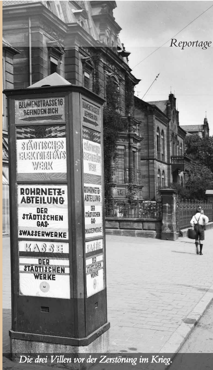
Die drei Villen vor der Zerstörung im Krieg.