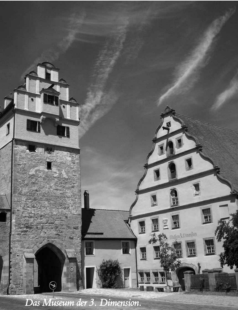
Das Museum der 3. Dimension.

Eine lange Straße zieht sich durch die von einer eiförmigen Wehrmauer umfasste Altstadt, von ihr öffnen sich die Plätze. Brettermarkt, Hafenmarkt, Brotmarkt, Schmalzmarkt und – am Neuen Rathaus – der Schweinemarkt. Hier handelten die Dinkelsbühler. Die wirtschaftliche Blüte im 14. und 15. Jahrhundert führte dazu, dass Vorstädte angelegt wurden. Der Kern blieb unberührt.