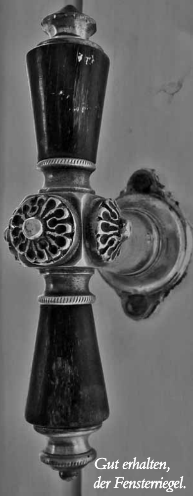
Gut erhalten, der Fensterriegel.