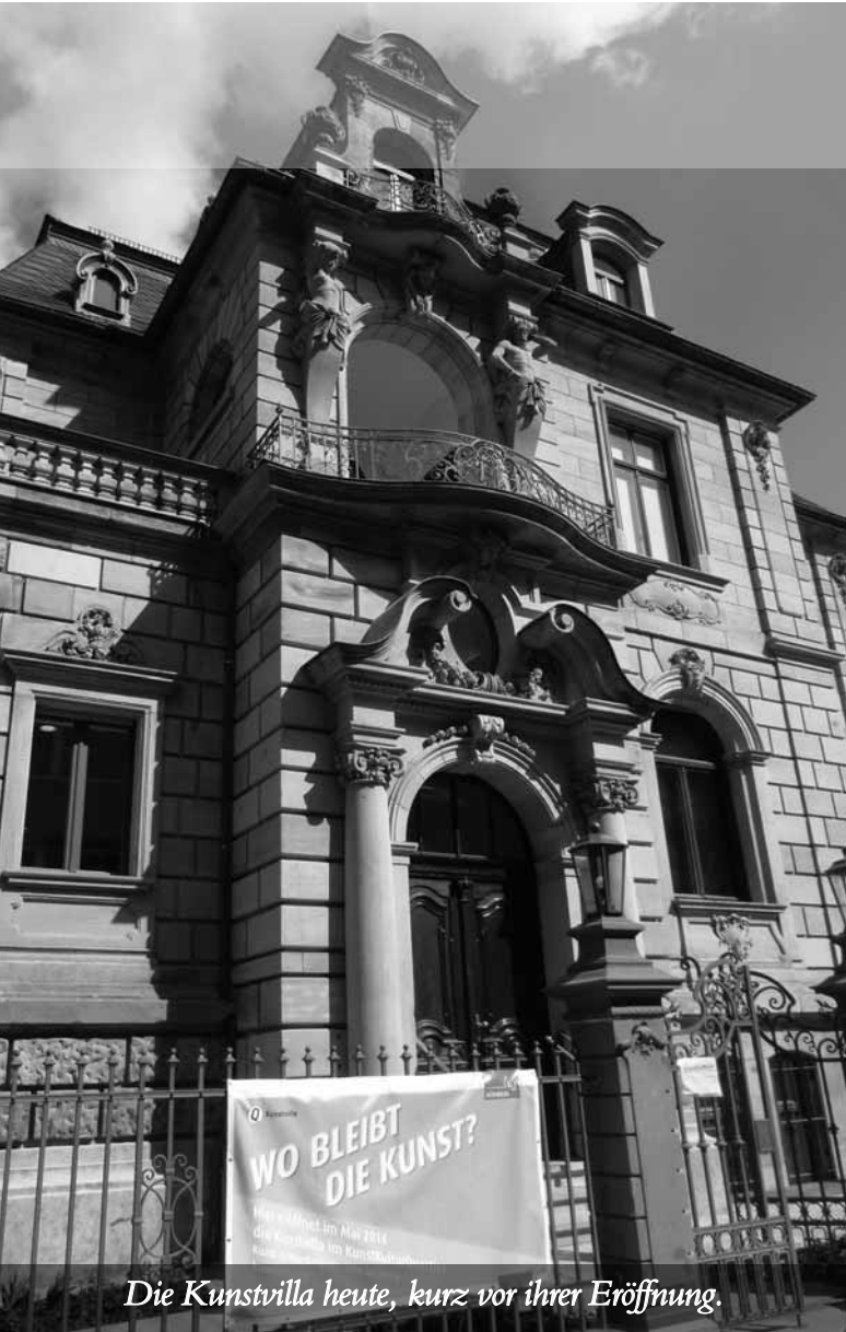
Die Kunstvilla heute, kurz vor ihrer Eröffnung.