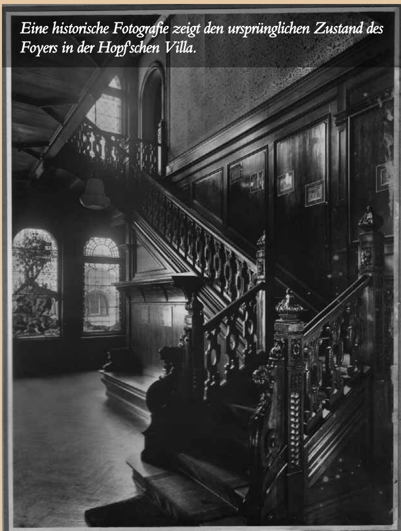
Eine historische Fotografie zeigt den ursprünglichen Zustand des Foyers in der Hopfschen Villa.

Sie kennt andere Beispiele. Beim Reinigen der Kassettendecke im „Besucherraum“ kam ein goldener Stern zum Vorschein. Das Parkett in einem Ausstellungsraum wurde nach historischem Vorbild neu gefertigt, die Kastenfenster mussten zur fachgerechten Restaurierung nach Chemnitz gebracht werden. Dazu kamen die Anforderungen an das öffentliche Gebäude wie Brandschutz, für den Türen mit automatischen Schließanlagen ausgestattet werden mussten, oder die Lüftungsanlage, die trickreich und unauffällig hinter einem Gitter in der Holzvertäfelung versteckt wurde. Ein Innenaufzug macht alle Geschosse auch für Menschen mit Behinderung zugänglich, die Kunst wird über den Außenaufzug transportiert.