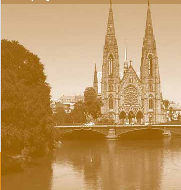
Das Straßburger Münster.