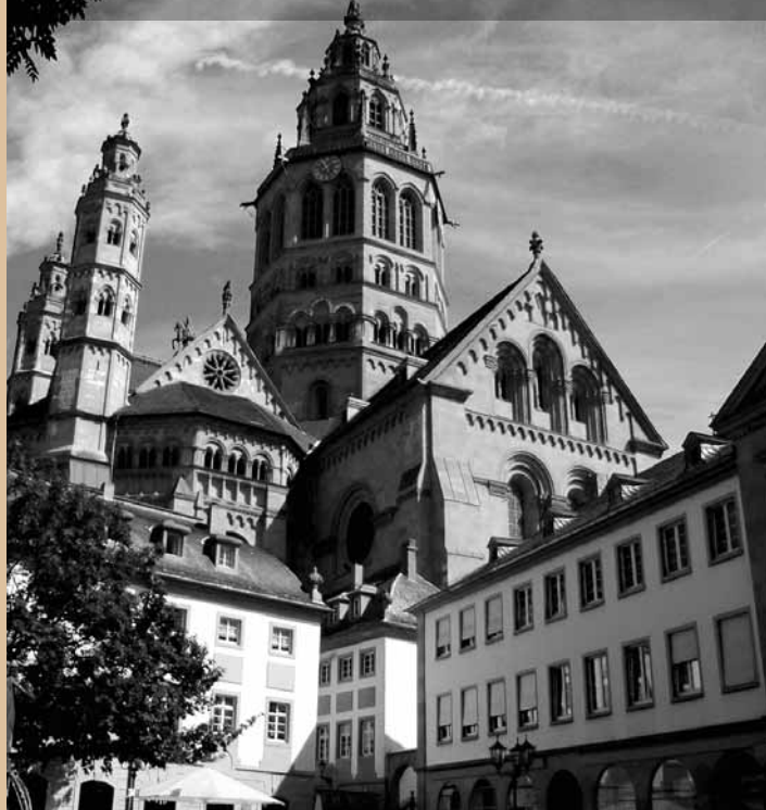
Der romanische Dom in Mainz.