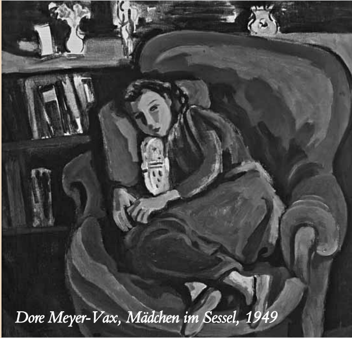
Dore Meyer-Vax, Mädchen im Sessel, 1949