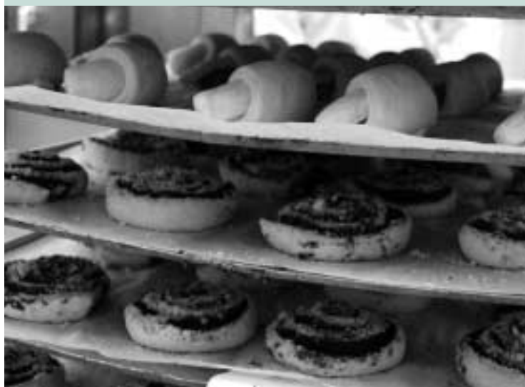
Schnecken und Nusshörnchen.

Wenig bekannt ist auch, dass die Erlanger Firma preisgekrönt ist. Dank einer freiwilligen qualifizierten Umweltleistung, zu der das Unternehmen sich verpflichtete, ist es Teilnehmer am Umweltpakt Bayern und steht für umweltverträgliches Wirtschaftswachstum. So führte „Der Beck“ bereits 1999 ein Umweltmanagementsystem nach der europäischen Öko-Audit-Verordnung ein. Das „Eco-Management and Audit-Scheme“ (EMAS) ist das System mit den weitreichendsten Anforderungen im Interesse des Umweltschutzes. Es geht weit über die gesetzlichen Regelungen hinaus. Jüngstes Beispiel für das Umweltmanagement: „Der Beck“ beteiligt sich an der Erlanger Klimaallianz, einem Bündnis zwischen der Stadt Erlangen und Unternehmen, Handwerks- und Verkehrsbetrieben zur Einhaltung bestimmter Umweltrichtlinien.