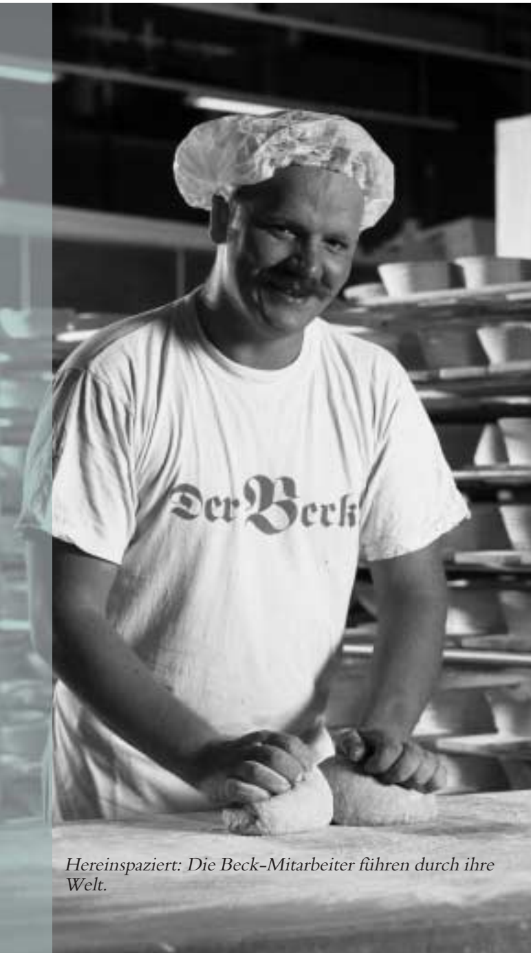
Hereinspaziert: Die Beck-Mitarbeiter führen durch ihre Welt.