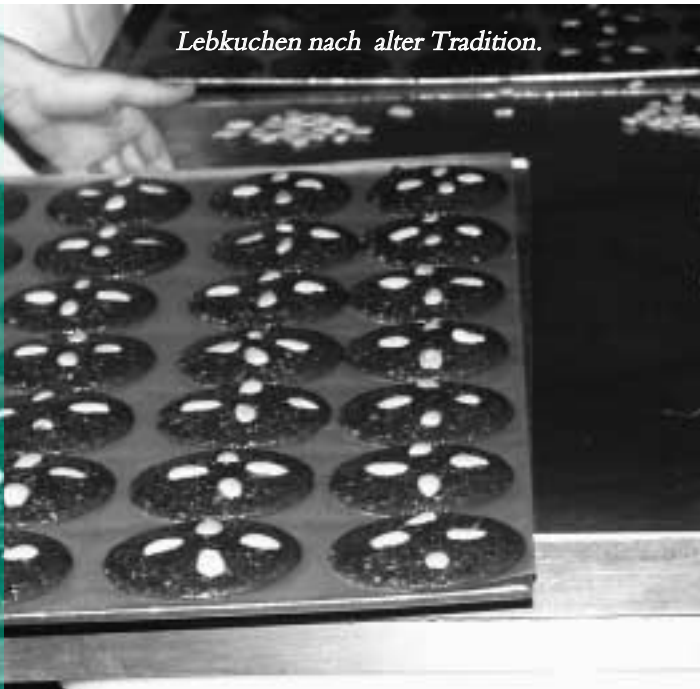
Lebkuchen nach alter Tradition.

Das gesellschaftliche und soziale Leben fördert das Unternehmen, indem es 1999 die „Beck Kinderfonds Stiftung“ ins Leben rief, um „die Not vor der Haustüre“ zu lindern und hilfsbedürftige Kinder aus der Region zu unterstützen. Mit dieser Einrichtung will „Der Beck“ sicherstellen, dass Spenden ganz ohne Umwege dorthin gelangen, wo sie drin-