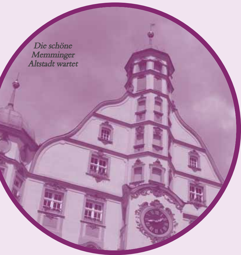
Die schöne Memminger Altstadt wartet

Um 14.30 Uhr ist die Rückfahrt ins Hotel. Der Nachmittag steht zur freien Verfügung, bis die Gruppe um 17.45 Uhr am Hotel in den Bus steigt. Das Abendessen wird heute im Restaurant Storchennest eingenommen, ein familiengeführtes Haus mit alpenländischem Flair und einer reichhaltigen Speisekarte.