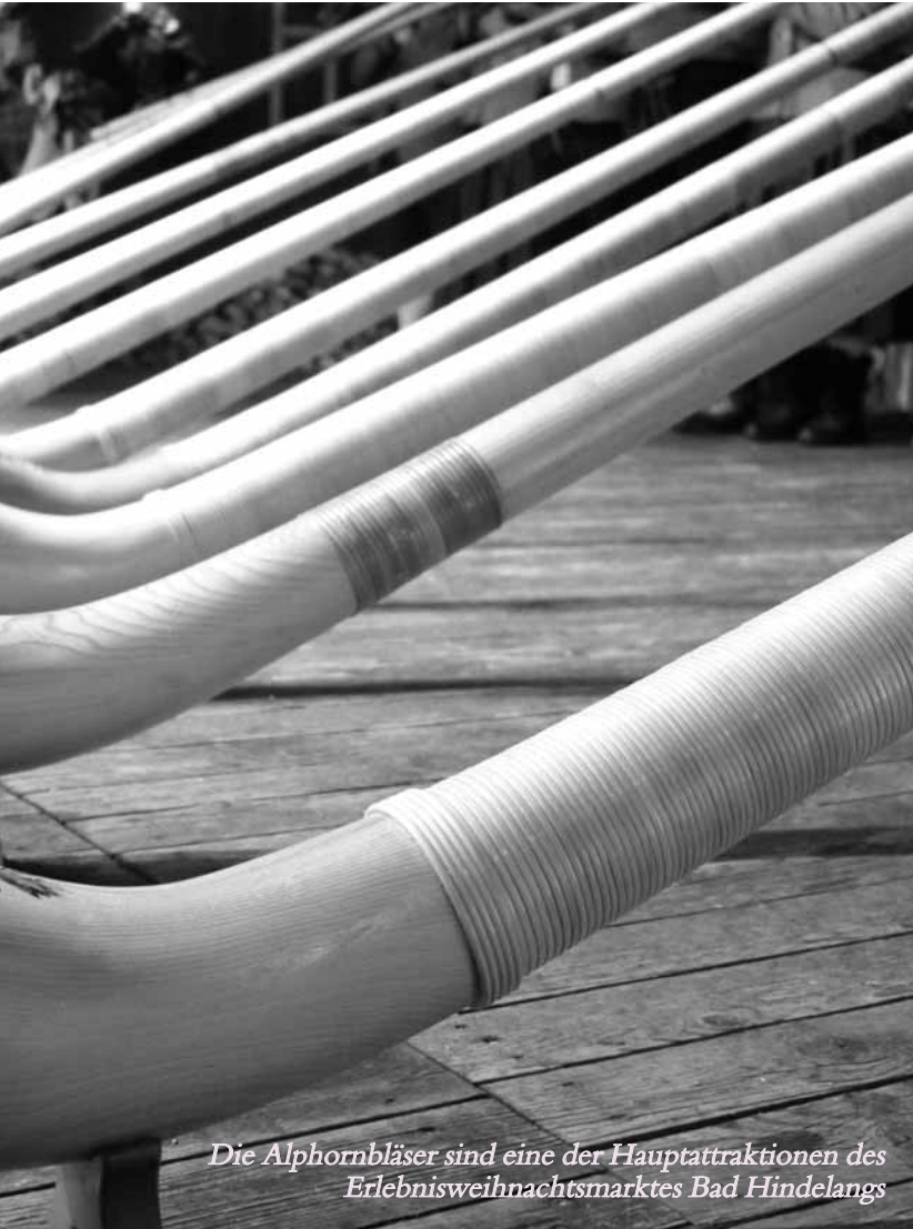
Die Alphornbläser sind eine der Hauptattraktionen des Erlebnisweihnachtsmarktes Bad Hindelangs

Ludwig Nübling hatten sich bewusst für ein natürliches Produkt entschieden: Bis heute verarbeitet Primavera ausgewählte und naturreine Rohstoffe ausschließlich am Firmensitz. Bei einer Führung durch das Haus, das nach Feng Shui-Prinzipien gestaltet ist, lernen die Besucher die Philosophie des Unternehmens kennen, finden Einblicke in die Produktion und die Büros. Diese „Liebeserklärung an Mensch und Natur“ findet ihre Fortsetzung im 600 Quadratmeter großen Shop, in dem Bio- und Naturkosmetik, Öle für die Aromatherapie und weitere Verwönmomente zu finden sind.