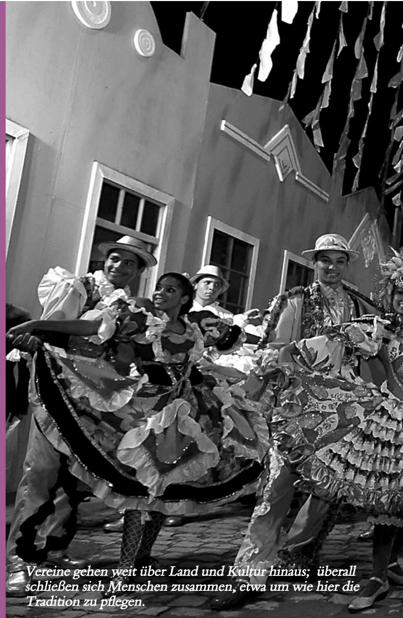
Vereine gehen weit über Land und Kultur hinaus; überall schließen sich Menschen zusammen, etwa um wie hier die Tradition zu pflegen.

Der Industrie- und Kulturverein hat eine eigene Geschäftsführerin. Ein Plus?