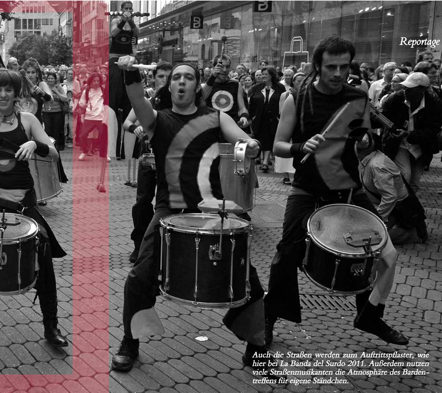
Auch die Straßen werden zum Auftrittspflaster, wie hier bei La Banda del Surdo 2011. Außerdem nutzen viele Straßenmusikanten die Atmosphäre des Bardentreffens für eigene Ständchen.

Wie stellen Sie sich auf junges Publikum und neue Musikstile wie Punk, Rap oder Techno ein?