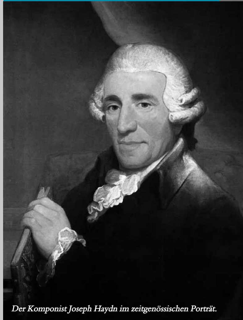
Der Komponist Joseph Haydn im zeitgenössischen Porträt.