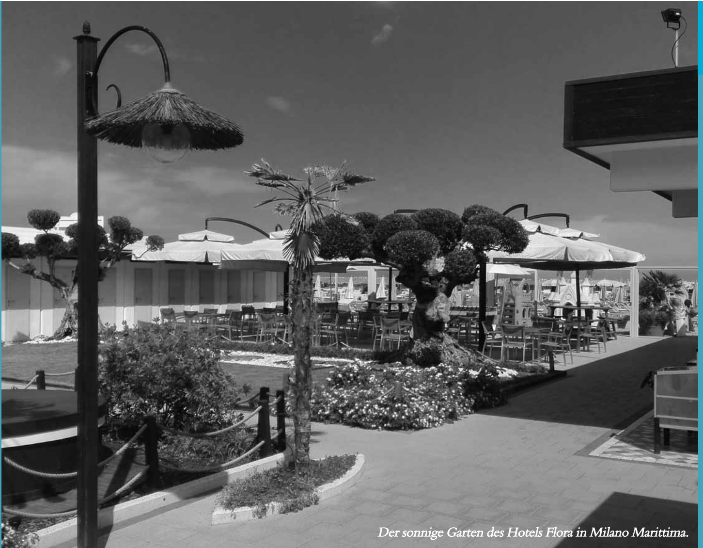
Der sonnige Garten des Hotels Flora in Milano Marittima.

Weiterfahrt in den Badeort Milano Marittima und Einchecken im Hotel Flora, einem kleinen, aber feinen und typisch italienischen Hotel. Es verfügt über einen Garten und einen schönen Pool, zudem ist ein Wellnessbereich mit Sauna und Türkischem Bad vorhanden. Das Hotel ist keine fünf Gehminuten vom Strand entfernt.