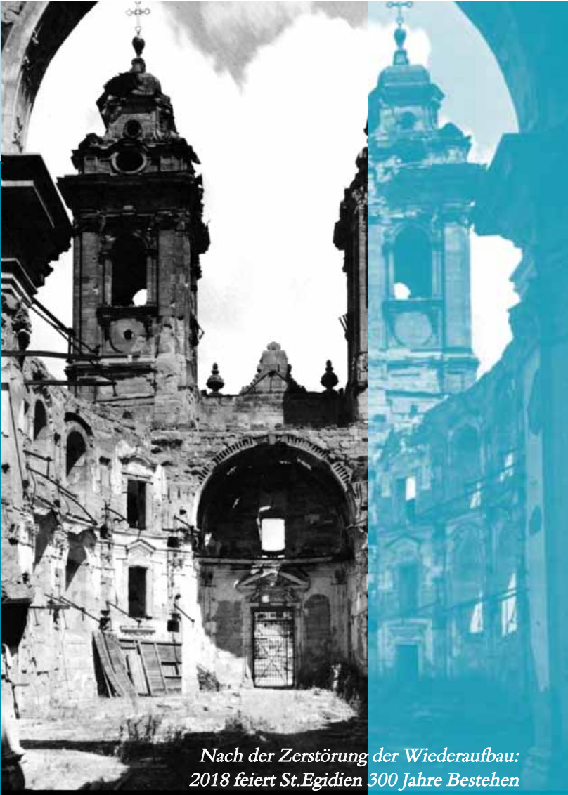
Nach der Zerstörung der Wiederaufbau: 2018 feiert St. Egidien 300 Jahre Bestehen