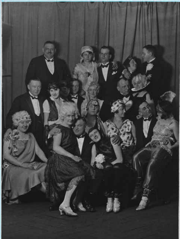
Fasching & Dinkel Weiß