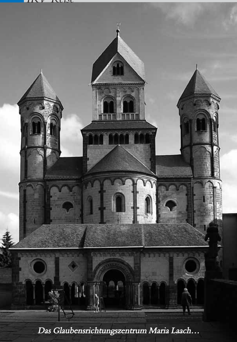
Das Glaubensrichtungszentrum Maria Laach...