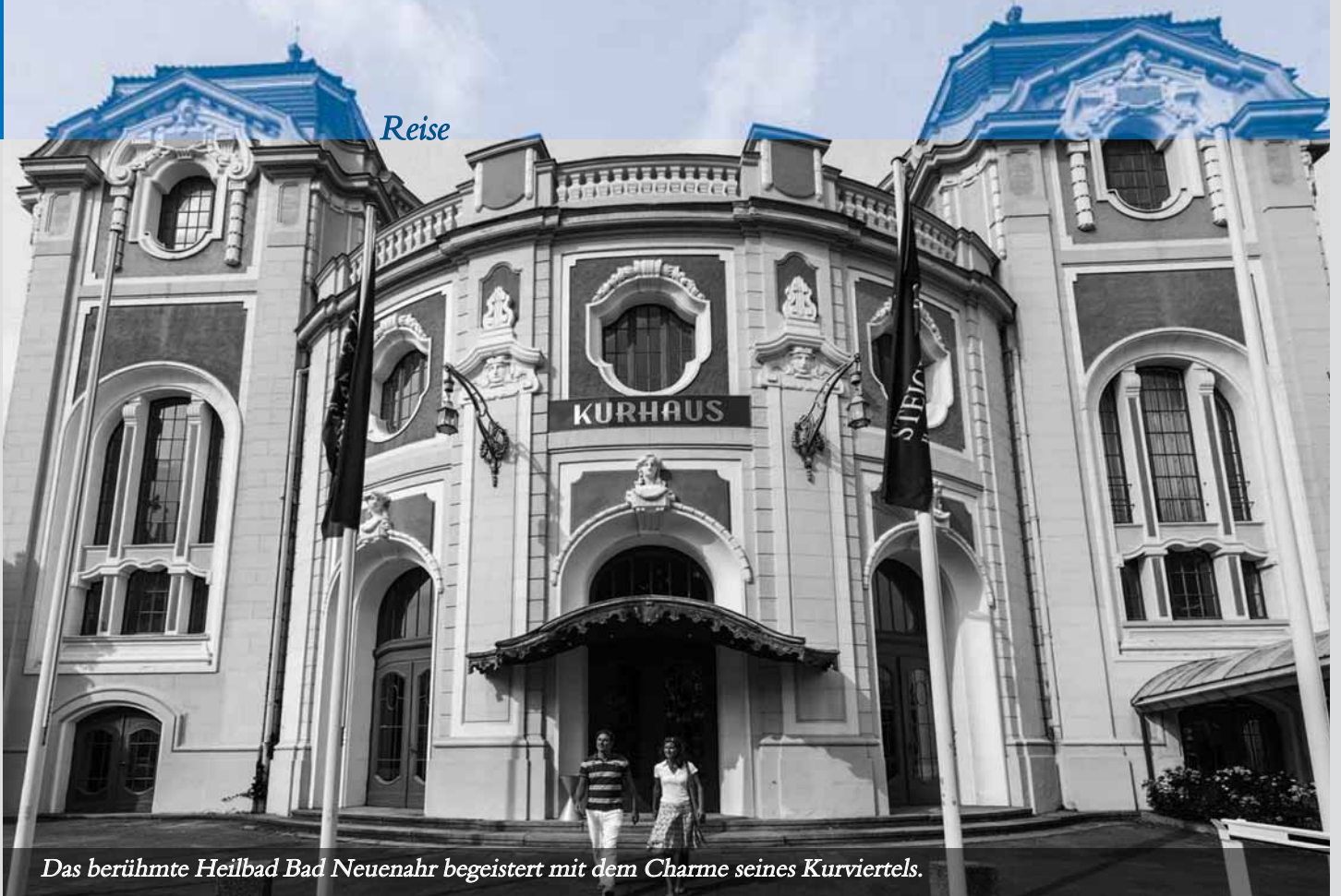
Das berühmte Heilbad Bad Neuenahr begeistert mit dem Charme seines Kurviertels.