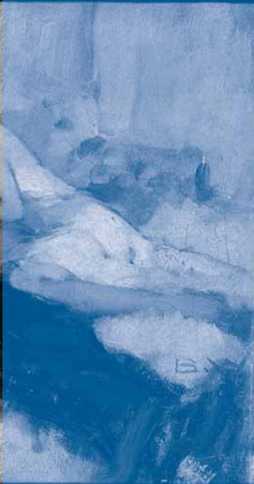
Dame und Clown.