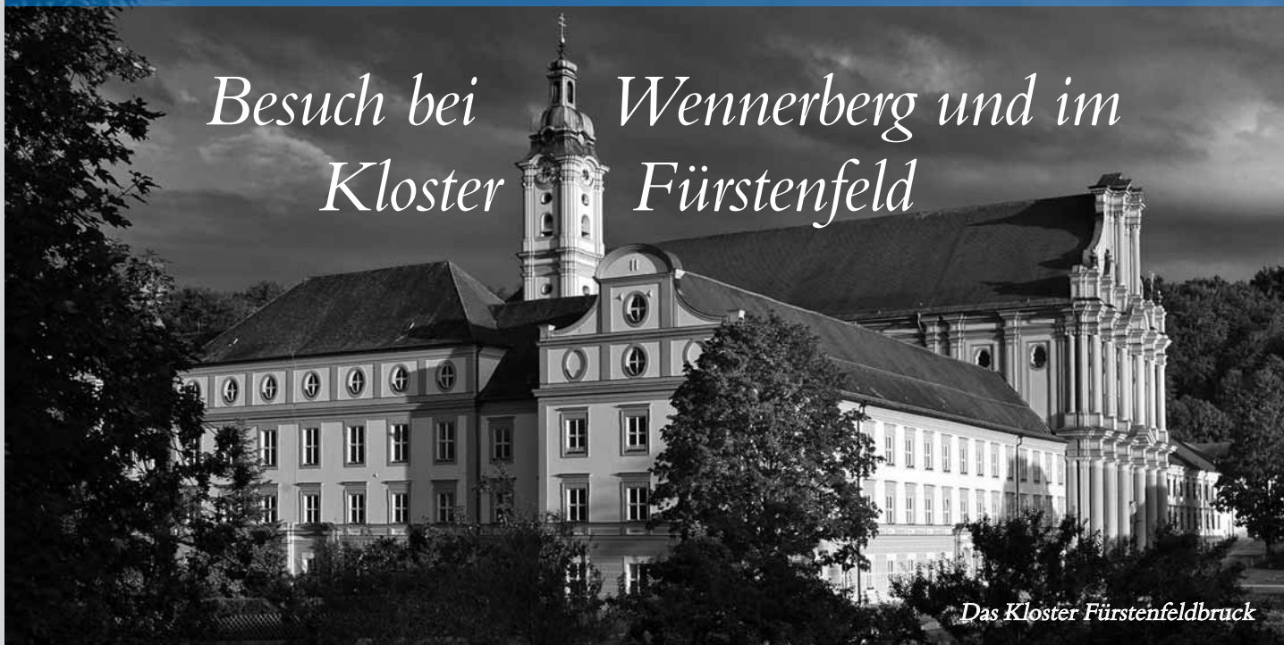
Das Kloster Fürstenfeldbruck

Tagesfahrt zur hochgelobten Ausstellung in Fürstenfeldbruck am 13. März 2014