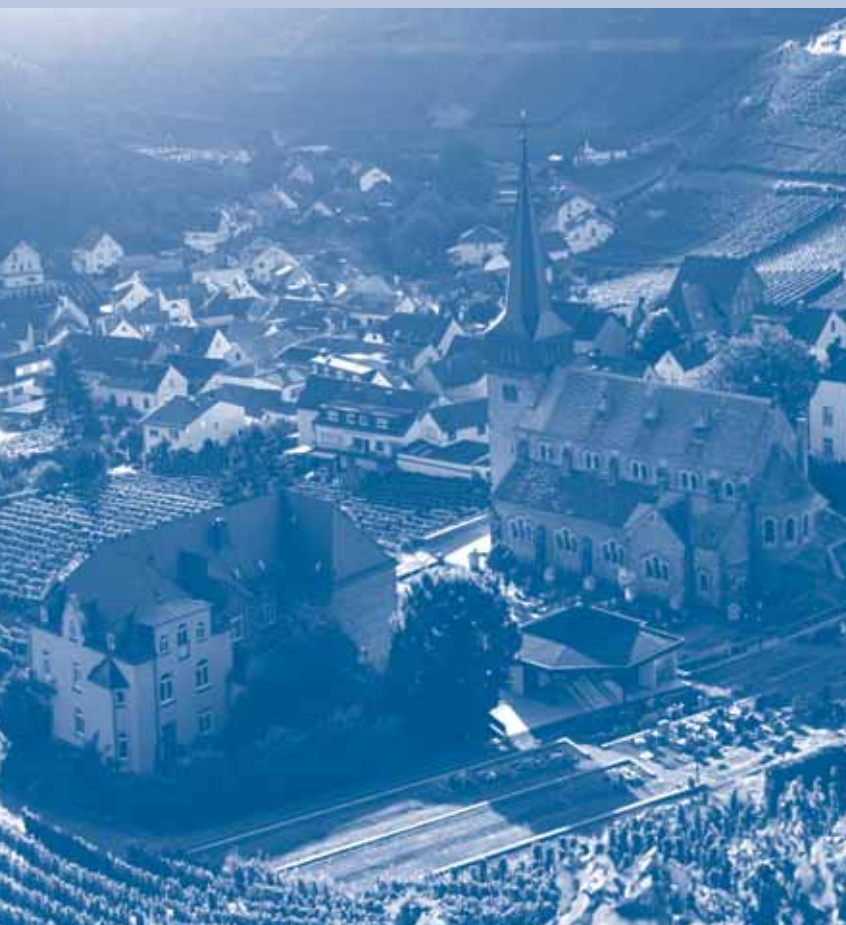
Der malerische Weinort Mayschoß.

Viertägige Weinfahrt ins Ahrtal vom 6. bis 9. Juli 2014