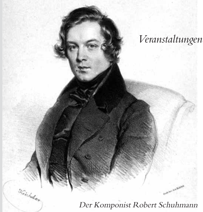
Der Komponist Robert Schumann