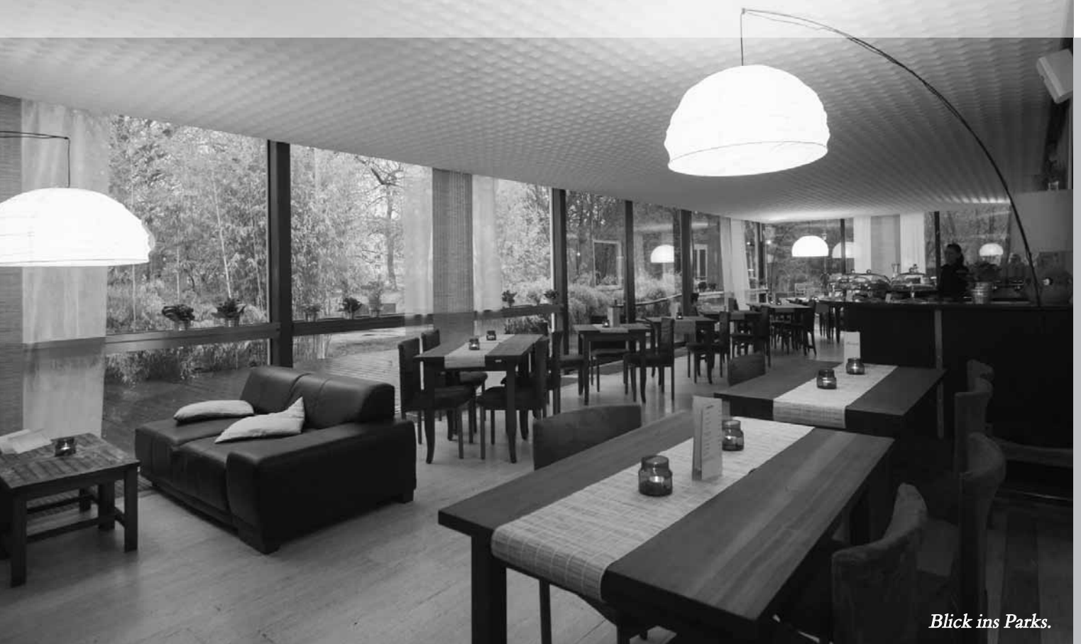
Blick ins Parks.