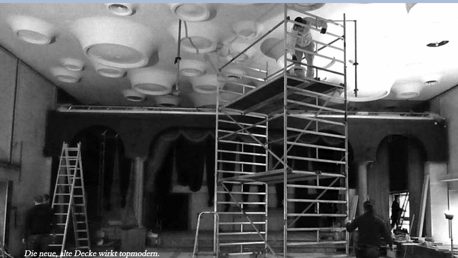
Die neue, alte Decke wirkt topmodern.

Und er ist das, was uns am meisten beschäftigt. Natürlich war er auch früher schon ein Thema, aber so ausführlich und kleinteilig dachte man damals noch nicht. Man ist sensibler geworden – nicht zuletzt ausgelöst durch das Brandunglück am Düsseldorfer Flughafen, bei dem 1996 siebzehn Menschen starben. Die Fluchtwege im Stadtparkrestaurant haben schon immer ausgereicht. Was noch nicht vorhanden ist, sind spezielle Brandschutztüren. Sie sind ausgeschrieben, vergeben und der Einbau ist für die achte Kalenderwoche avisiert – so dass Saal, Foyer, Flur und Keller abgeschottet sind und alles den Vorschriften entspricht.