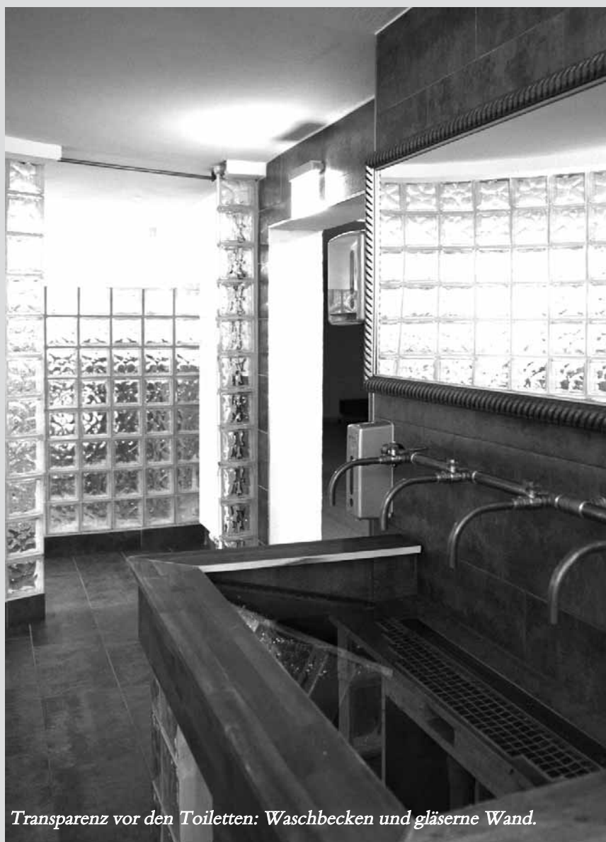
Transparenz vor den Toiletten: Waschbecken und gläserne Wand.

Dass im Keller zwei Kegelbahnen sind, wusste ich überhaupt nicht! Im Untergeschoss sind Räume, die für die Arbeitsvorbereitung der Küche gedacht waren, auch eine Konditorei und ein Kartoffelkeller. Zudem eine Bierstube und eine abgesenkte Hausmeisterwohnung. Die sollen derzeit aber ungenutzt bleiben. Hier einzugreifen lohnt sich erst, wenn oben der Laden wieder brummt.