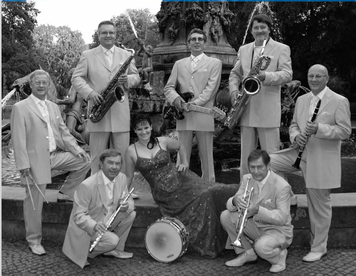
Das Noris Swingtett wird den Ball mit frühlingshaften Melodien in Schwung bringen.

Sein Kennzeichen sind deutliche, schnelle Hüftbewegungen – getanzt wird im 2/4 Takt, das Turniertempo liegt zwischen 44 und 53 Takten. Dabei bewegt sich das Becken vor und zurück, die Füße variieren den Grundrhythmus. Quick-quick-slow etwa oder Slow-quick- quick-quick-quick-quick. Schwierig? Auf jeden Fall sexy. Noch mehr Erotik verströmt dennoch die Rumba, während Jive, Cha Cha Cha oder Paso Doble vor Energie sprühen.