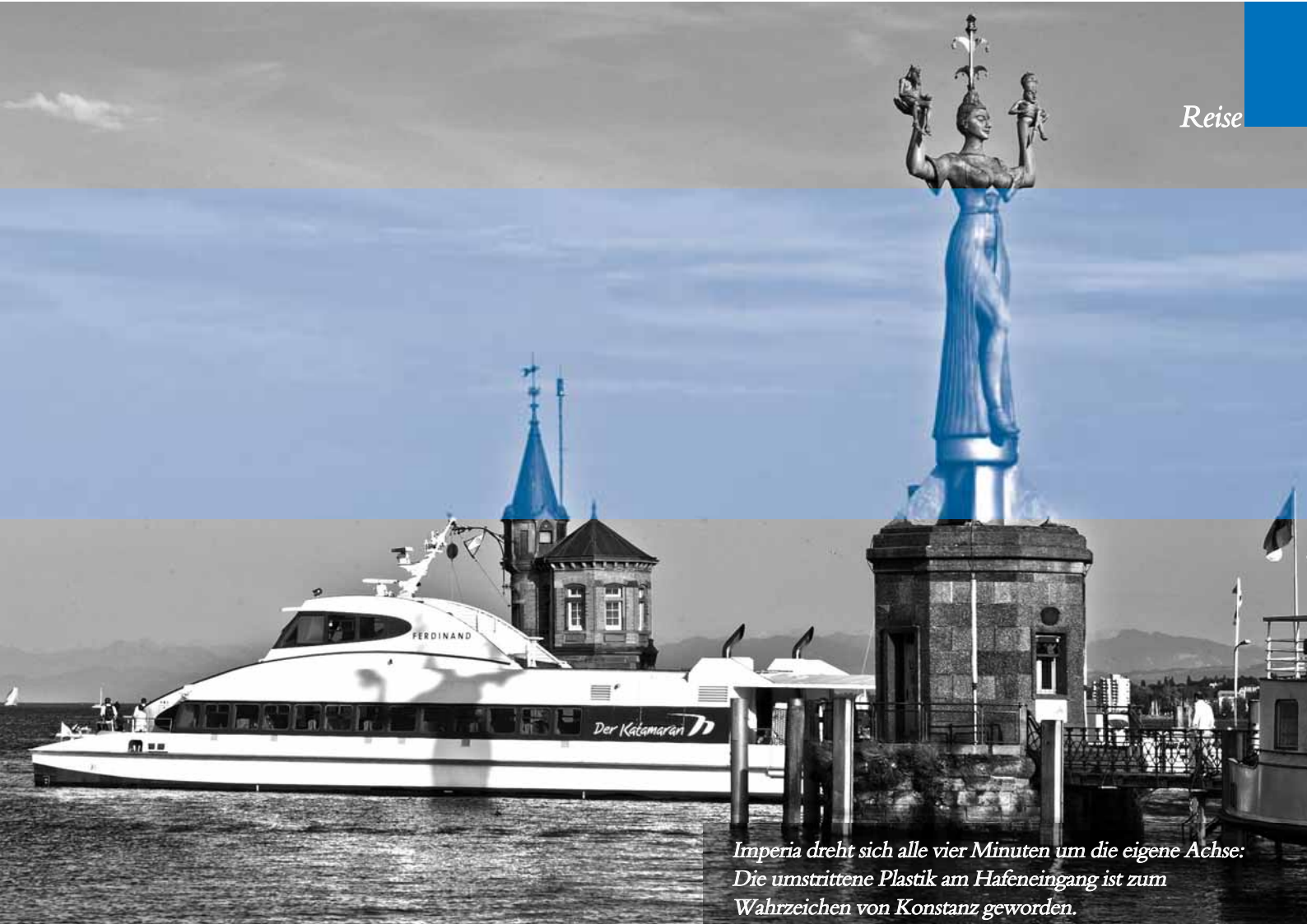
Imperia dreht sich alle vier Minuten um die eigene Achse: Die umstrittene Plastik am Hafeneingang ist zum Wahrzeichen von Konstanz geworden.

Das bedeutendste Ereignis für Konstanz war sicher das Konzil, das von 1414 bis 1418 in Konstanz tagte. In der einst mächtigen Bischofsmetropole – im 10. Jahrhundert vom Heiligen Konrad als das „zweite Rom“ errichtet – sollte ein neuer Papst gewählt werden. Martin V blieb der einzige, der jemals außerhalb von Rom gekürt wurde. Zuvor hatte der tschechische Reformator Jan Hus seine Lehre verteidigt, war darauf jedoch als Ketzer angeklagt und 1415 auf dem Scheiterhaufen hingerichtet worden. Die ganze Geschichte erzählt das Hus-Museum.