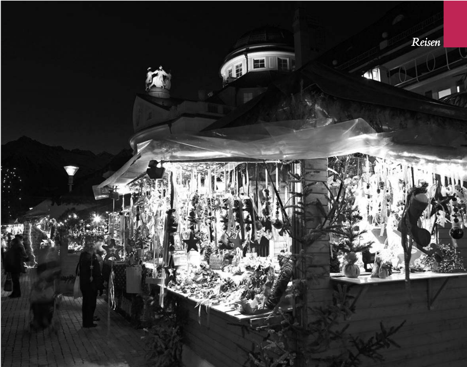
Der Weihnachtsmarkt in Meran

So sah der „Mann aus dem Eis“ wohl aus, als er noch lebte.