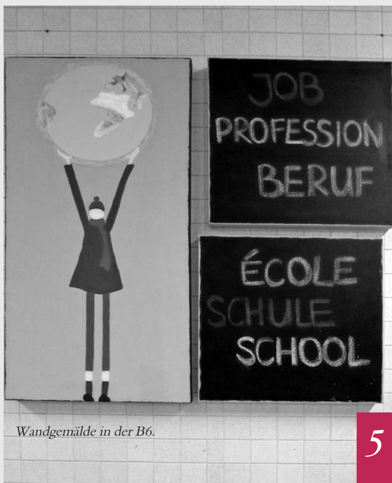
Wandgemälde in der B6.