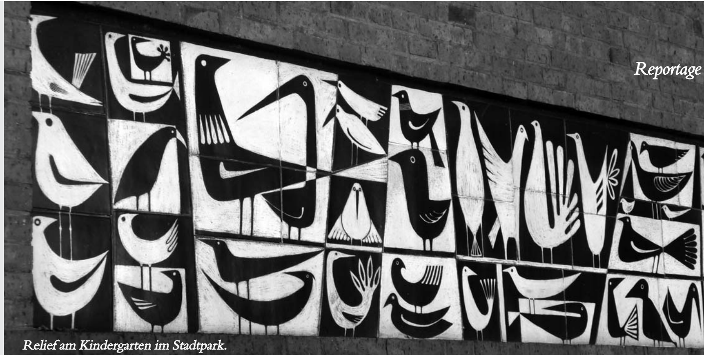
Relief am Kindergarten im Stadtpark.

Wo anfangen? Im Stadtpark, gleich am Café und von dort nach Osten. Wo die Sonne aufgeht und das Berufsbildungszentrum steht. Gleich über die vielbefahrene Äußere Bayreuther Straße lernen jede Woche 10.000 junge Menschen, was sie in ihrem Beruf brauchen. Der Komplex am Berliner Platz ist die größte derartige Einrichtung in Deutschland: Unter seinem Dach finden sich sechs berufliche Schulen und eine Fernuniversität.