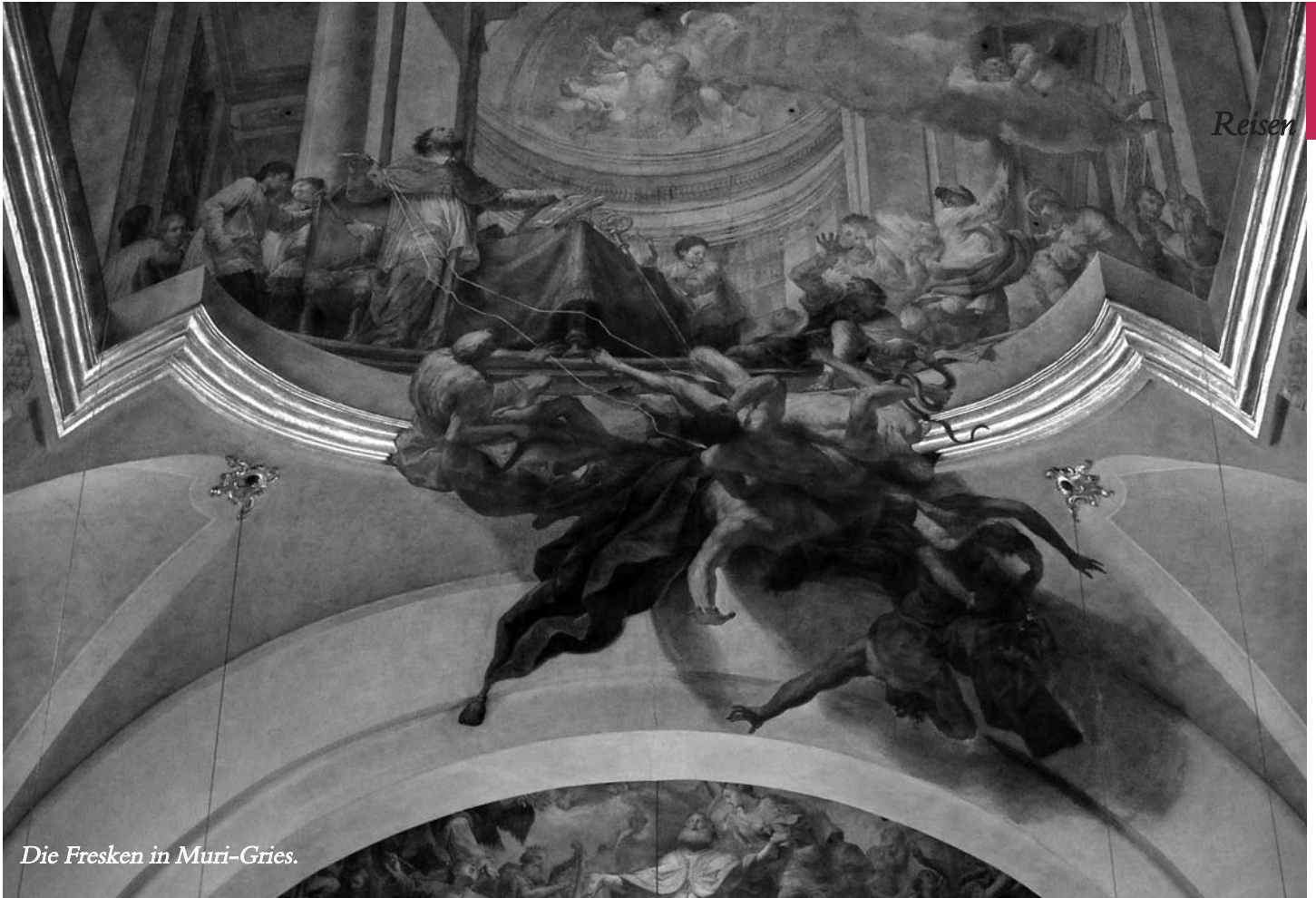
Die Fresken in Muri-Gries.