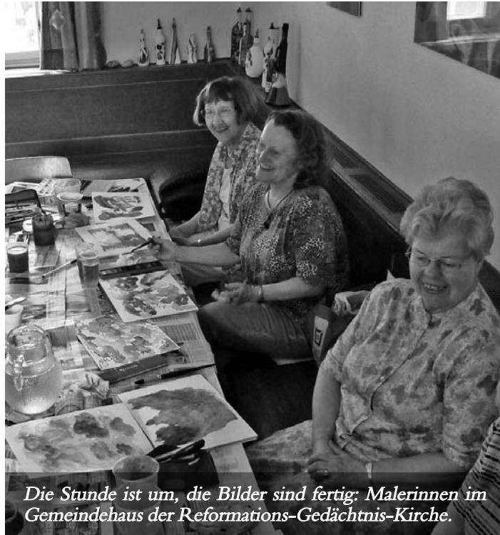
Die Stunde ist um, die Bilder sind fertig: Malerinnen im Gemeindehaus der Reformations-Gedächtnis-Kirche.