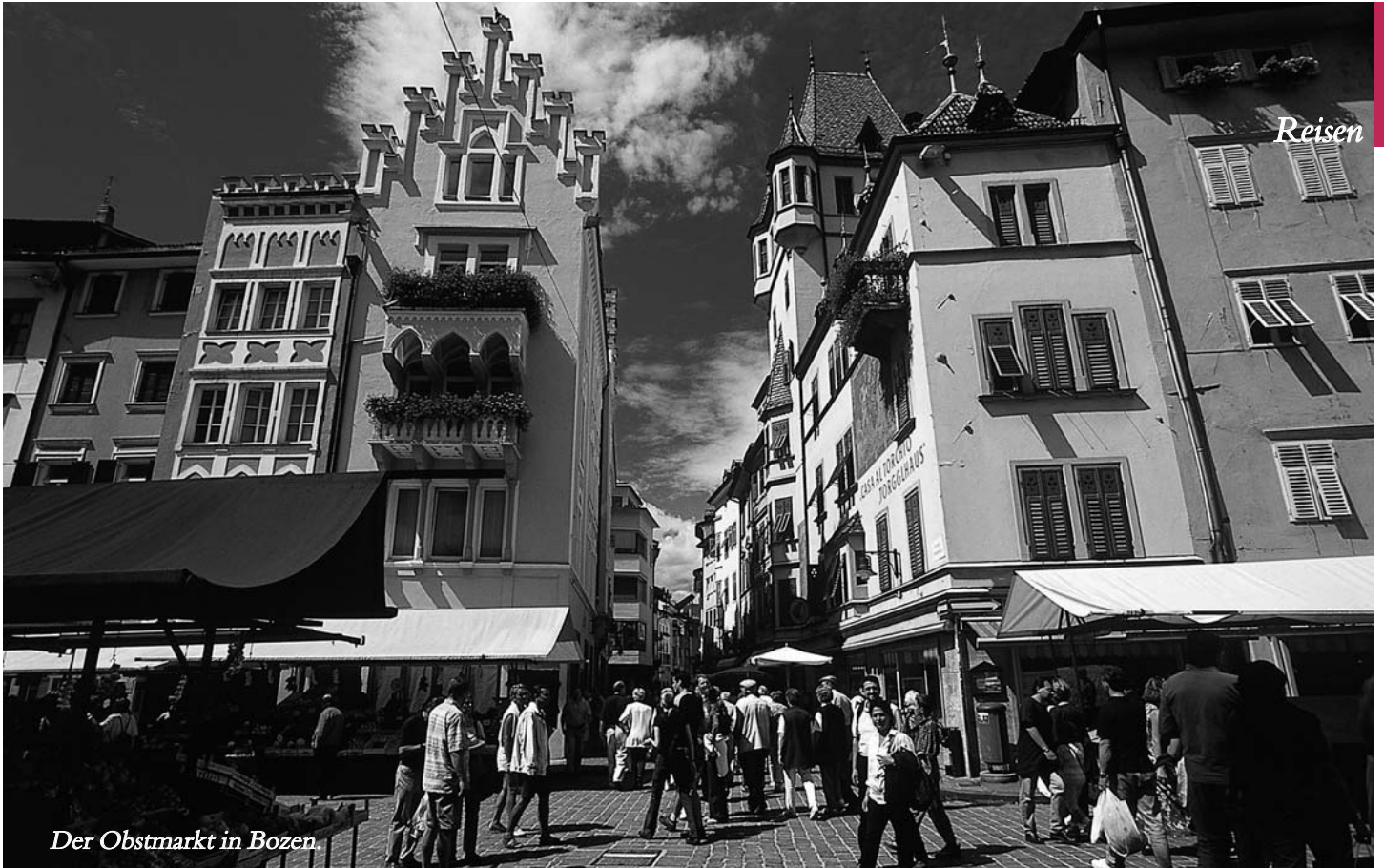
Der Obstmarkt in Bozen.