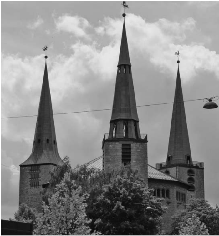
Die Reformations-Gedächtnis-Kirche mit ihren markanten Türmen.

Die Künstlerinnen sind durchaus ambitioniert. Sie setzen sich Themen wie beispielsweise Gesichter oder Perspektive, ahmen die Malweise großer Künstler nach. Ihre Techniken variieren von der Bleistiftzeichnung über das Aquarell bis zu Acryl. Und natürlich besuchen sie Ausstellungen, jüngst eine in der Villa Dessauer in Bamberg. Neue Mitglieder, nicken die Frauen, sind – immer mittwochs von 10 bis 12 Uhr – herzlich willkommen.