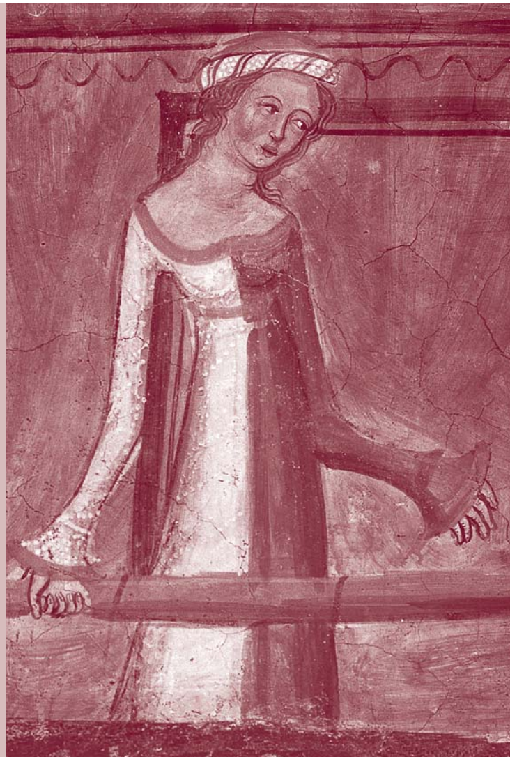
Mittelalterliche Fresken schmücken Schloss Runkelstein.