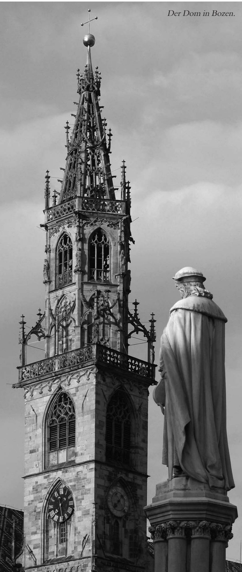
Der Dom in Bozen.

Folgende Erlebnisse und Besichtigungen sind für unsere Reise nach Bozen geplant: