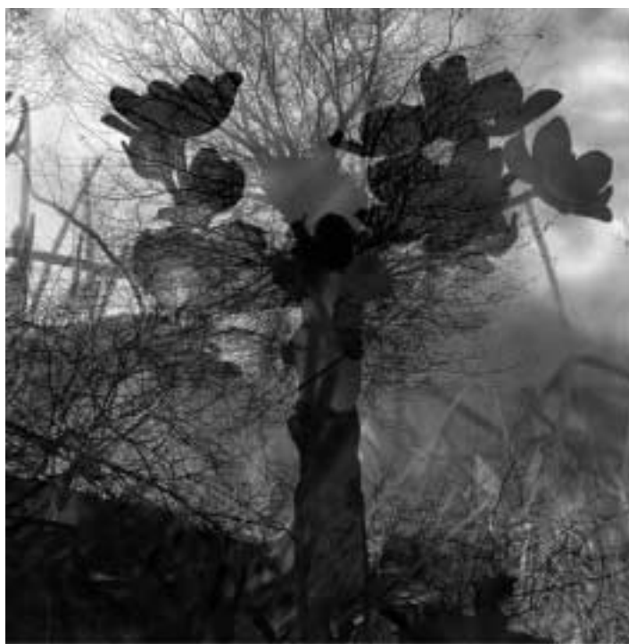
„Der blaue Baum der Romantik“