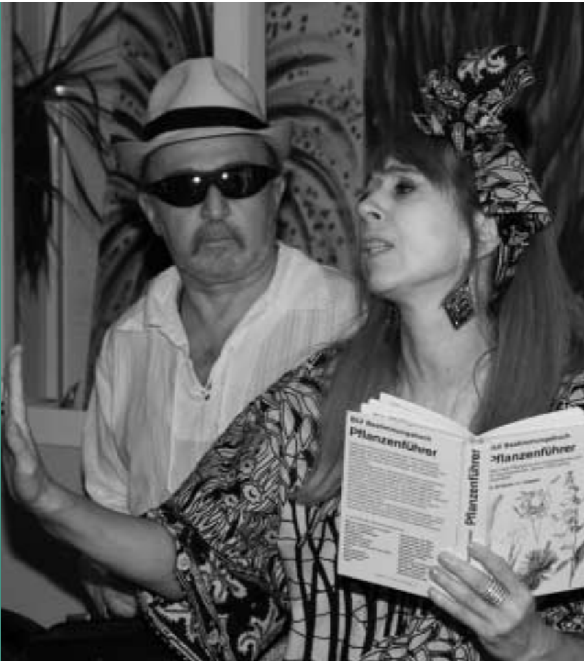
Die „Latenten Talente“ in Aktion.