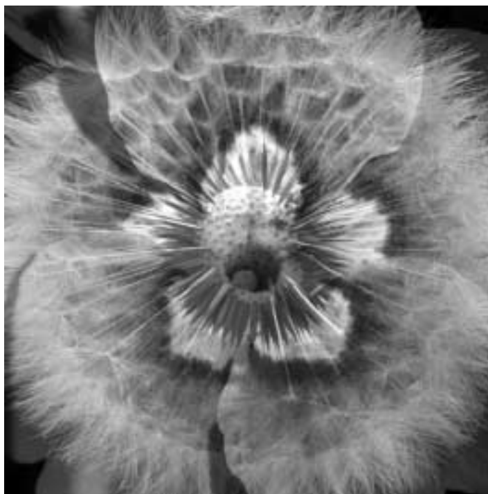
„Kleines kann großartig sein“