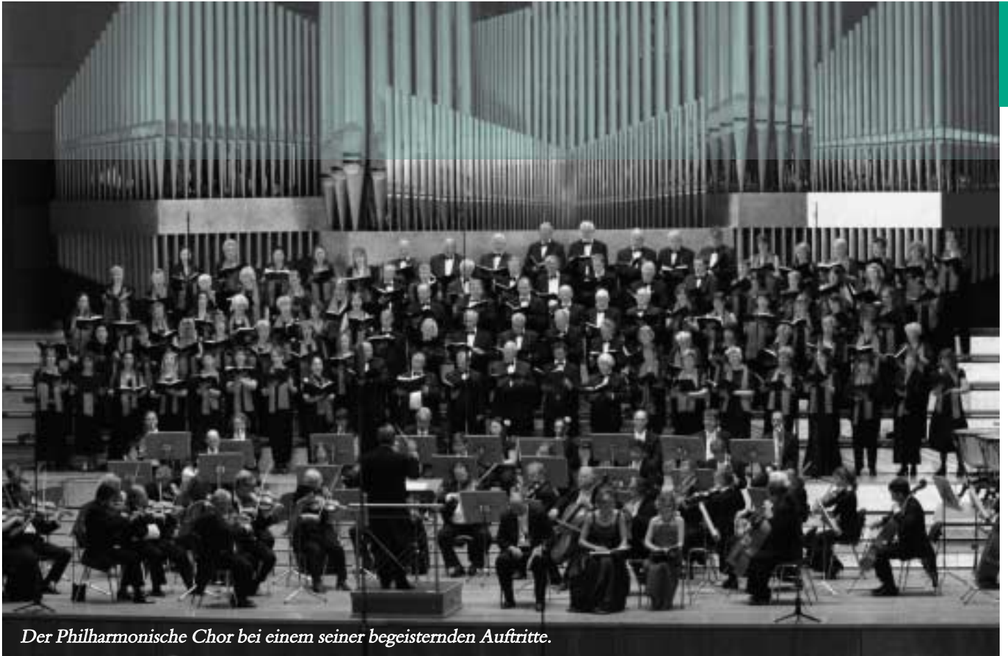
Der Philharmonische Chor bei einem seiner begeisternden Auftritte.