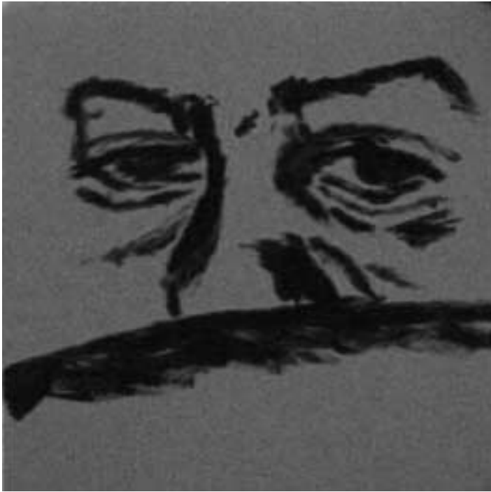
Eines von Fellers „Faces“.

listische Elemente mit ein. „Für mich gehören Kunst und Politik zusammen“, betont er. „Ich kann nicht wegsehen und in einem luftleeren Raum arbeiten. Ich verarbeite die Eindrücke, die ich erhalte. Und das sind eben vor allem die aktuellen Lebensumstände“. Was der junge Künstler damit meint, konnte man kürzlich in der Villa Leon begutachten, wo er an der Gemeinschafts-Ausstellung „Human Rights“ der internationalen Künstlergruppe „Weit her – nah dran“ beteiligt war. Die Schau für die Menschenrechte, die dieser Tage zu Ende ging, wurde parallel zur Verleihung des Menschenrechtspreises an Eugénie Musayidire aus Ruanda eröffnet. Eine Fellersche Werkreihe befasste sich mit dem Irak-Krieg. Ein schweres Thema. Umgesetzt hat er es in hochwertigen Acrylbildern unter dem Titel „Häuserkampf“, die die blutige Seite des Konflikts darstellen. Die Farben wirken zunächst kräftig und schön, erinnern mit ihren Orange-Gelb-Braun-Tönen an den Orient. Doch hier geht es nicht um pittoreske Bauten, wie man auf den ersten Blick denken könnte. Immer wieder unterbrechen schwarze Striche und Kästen diese trügerische Idyl-