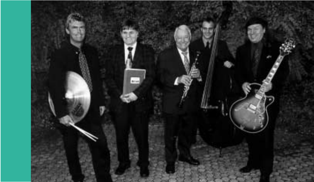
Hugo Strasser und seine Band freuen sich auf ihren Auftritt beim IKV.

Was muss ein Musiker eigentlich tun, um zur „Legende“ zu werden? Ist die Anzahl der verkauften Platten ausschlaggebend? Die Präsenz in den Medien? Die Anzahl der „Dienstjahre?“ Oder doch die musikalische Qualität und Virtuosität? Jeder mag die Frage, was legendär ist, anders beantworten und an manchen Künstlern scheiden sich auch die Geister. Einige aber gibt es, denen jeder Befragte den Legenden-Status zubilligt, egal, ob man persönlich ein Freund der jeweiligen Musikrichtung ist oder nicht.