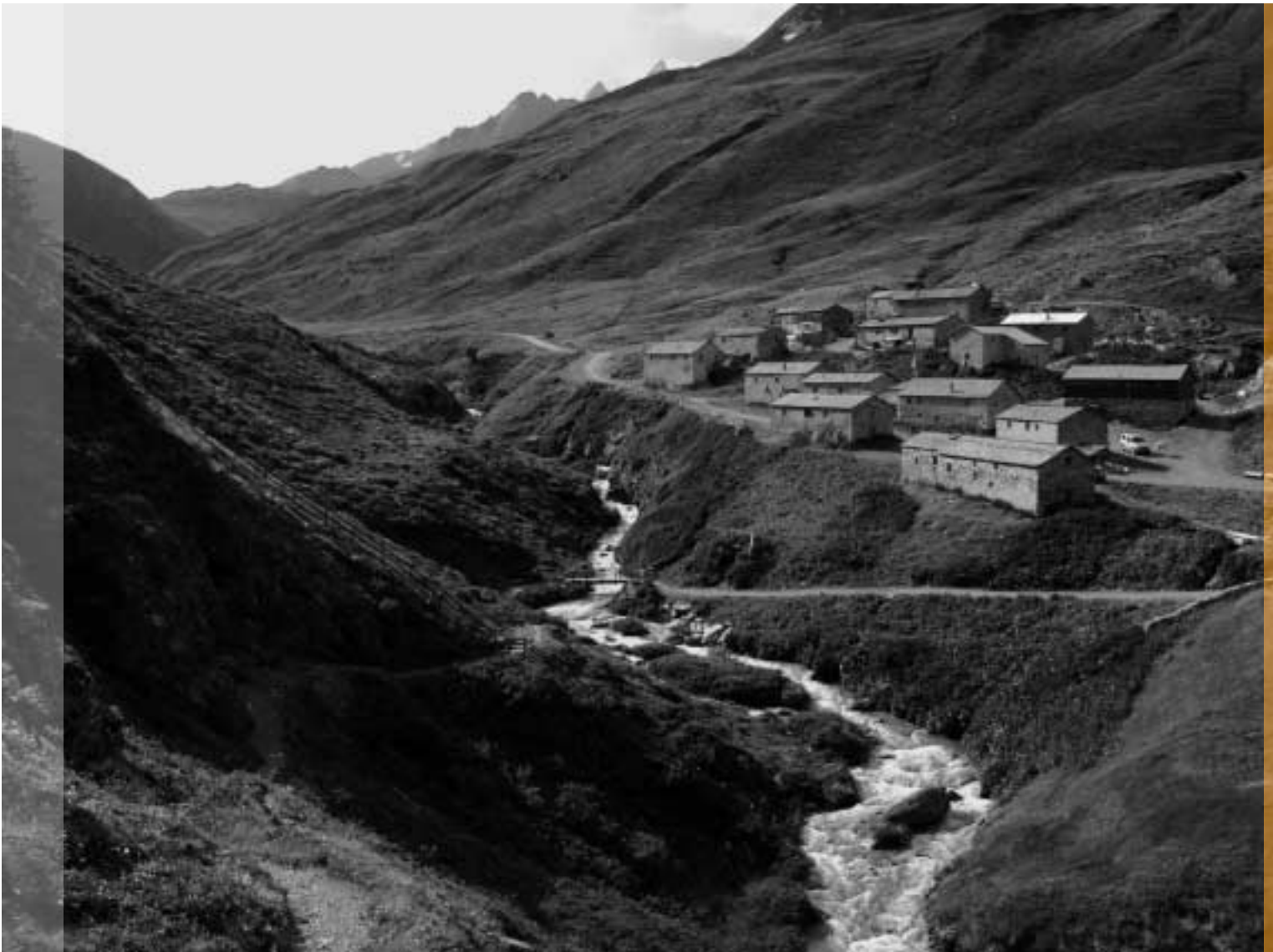
Die einzigartige Jagdhausalm.

Ebenso reizvoll sind die Patscheralm und die Bruggeralm. Ein geografischer Überblick zeigt, dass das Defereggental, ein Seitental des Iseltales, vom schluchtartigen Eingang, der Klamme bei Huben, in Ost-West-Richtung verläuft. Bei Patsch biegt das Tal nach Nordwesten ab. Dieser Abschnitt mit den Almen Patsch, Oberhaus, Seebach und Jaghaus ist landschaftlich besonders reizvoll. Hier bei Jagdhaus gabelt sich das Gebiet in zwei einsame Hochtäler, das Schwarzach- und das Arvental.