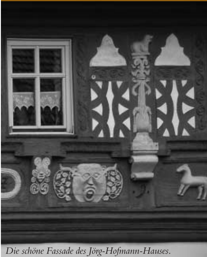
Die schöne Fassade des Jörg-Hofmann-Hauses.

Der erste Raum ist der Geschichte der Photographie von den Anfängen bis zu den modernen Autofokuskameras und dem APS-Photosystem gewidmet. Ausgestellt sind Juwelen wie die Voigtländer Metallkamera von 1840, die zur Herstellung von Daguerrotypen geeignet war, eine Nassplattenkamera von 1860 und zahlreiche Reisekameras für Trockenplatten. Neben Detektivkameras, Zweiäugigen Spiegelreflexkameras, den Fotoapparaten für Glasplatten und Rollfilm wird die Entwicklung der