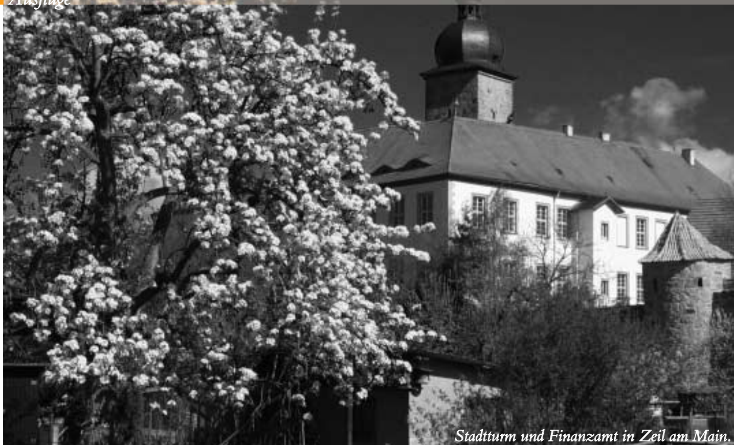
Stadtturm und Finanzamt in Zeil am Main.

von Schönborn wurde auf Fürsprache der Muttergottes zu Limbach von einem Hüftleiden geheilt und gelobte daher 1743, die Gnadenkirche zu erweitern und in ansehnlichen Stand zu setzen. Hierfür stellte er testamentarisch eine hohe Summe zur Verfügung. Diese reichte aber dennoch nicht ganz aus, so dass der Baumeister selbst Gelder vorstrecken musste.