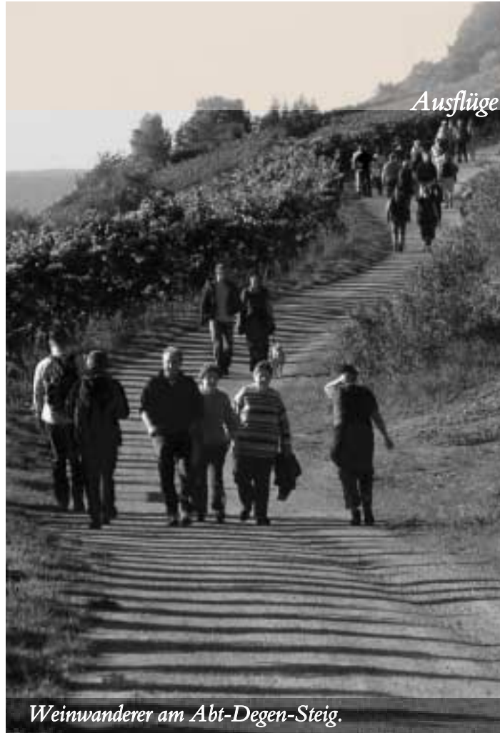
Weinwanderer am Abt-Degen-Steig.

Der Ort war einst fränkisches Königsgut. Kaiser Heinrich II. erwarb die damalige Siedlung „Curia Cilin“ vom Markgrafen zu Schweinfurt und übergab sie dem Kloster Michelsberg in Bamberg. Nach Heinrichs Tod erwarb Bischof Eberhard I. im Tausch Cilin von den Benediktinern. Eine Stadtrechtsverleihung ist nicht bekannt, 1383 wird Zeil dann erstmals als Stadt genannt. 1598 betrieb das Hochstift Bamberg die Rückkehr der Bürger zum katholischen Glauben. Zeil am Main war neben Bamberg Schwerpunkt der Hexenprozesse während des Dreißigjährigen Krieges. Bis zur Errichtung des Bamberger Malefizhauses 1627 war Zeil sogar die zentrale Stelle des Geschehens. 1695 wurde in Zeil ein fürstbischöfliches Jagdschloss erbaut. Das Oberamt des Hochstiftes Bamberg gelangte mit der Säkularisation 1803 an Bayern und wurde 1810 im Zuge von Grenzvereinbarungen dem Großherzogtum Würzburg überlassen, mit welchem es 1814 endgültig an Bayern fiel. Im Zuge der Verwaltungsreformen in Bayern entstand mit dem Gemeindeedikt von 1818 die heutige Gemeinde Zeil.