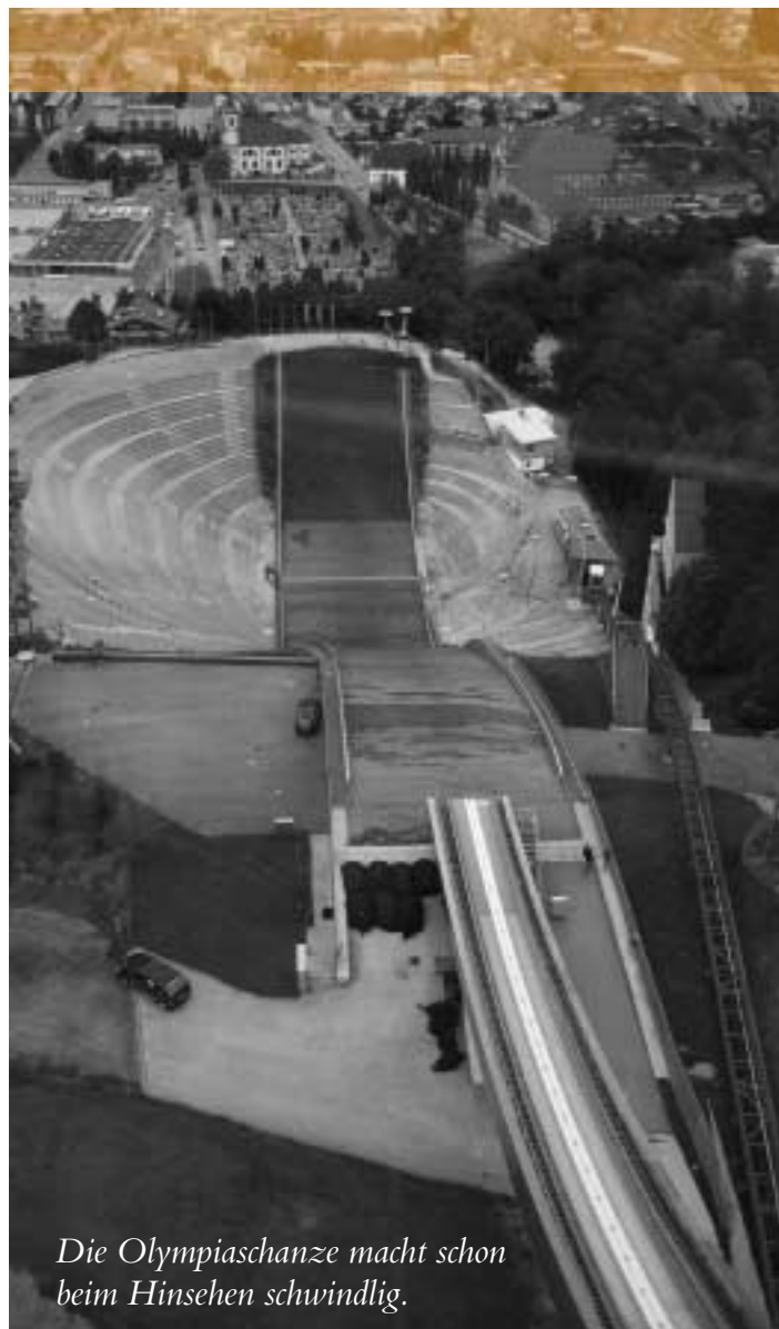
Die Olympiaschanze macht schon beim Hinsehen schwindlig.

Ein 1893 von den Tiroler Kaiserjägern errichtetes Denkmal erinnert hier an den berühmten Freiheitskämpfer Andreas Hofer.