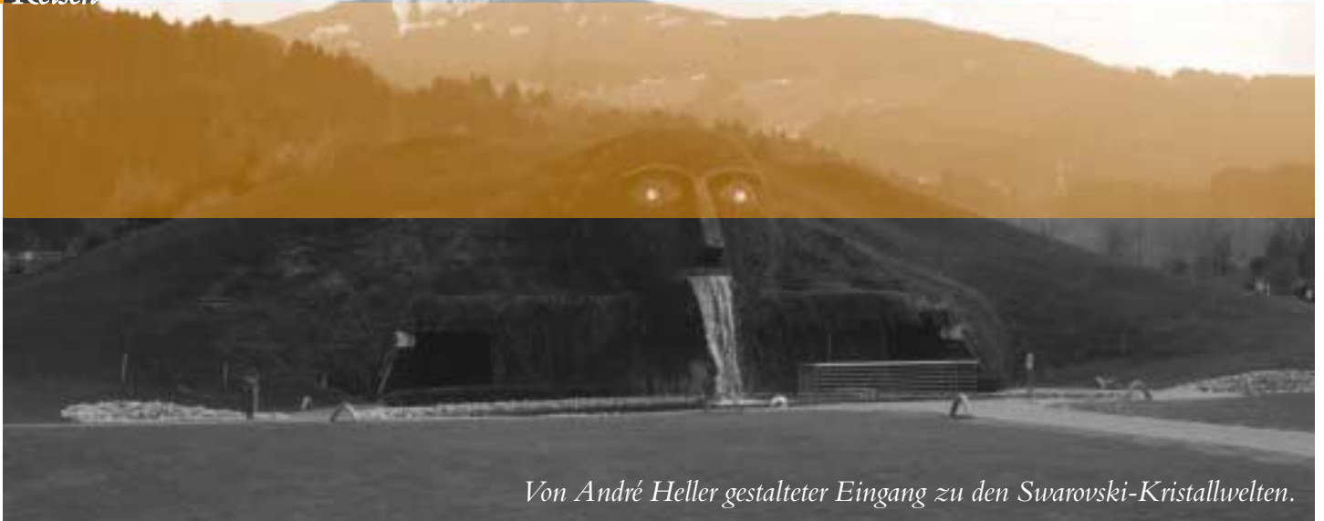
Von André Heller gestalteter Eingang zu den Swarovski-Kristallwelten.

Natürlich fehlt auch nicht eine Rüstkammer mit einer umfangreichen Sammlung. Zurück geht es wieder mit dem Bummelzug.