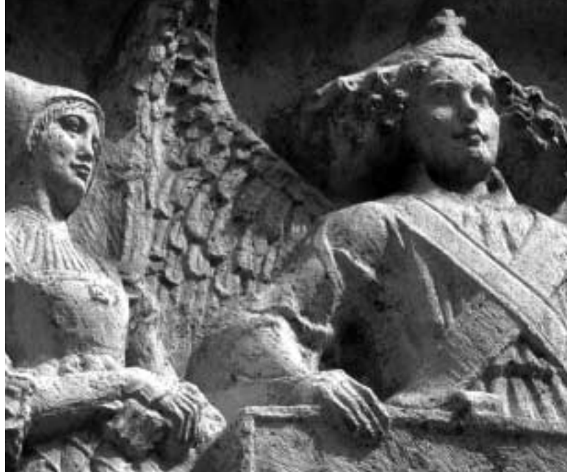
Detail einer schönen Fassadenverzierung.

Tratzberg, ein Juwel unter den Schlössern Österreichs, wurde im Jahre 1500 hoch über dem Inntal erbaut und diente schon Kaiser Maximilian I. und den Fuggern als Jagdschloss. Erlesen ausgestattet und in der Renaissance reichhaltig erweitert, ist das Schloss seit 1848 privater Wohnsitz der Grafen Enzenberg. Kaiser, Ritter und andere aristokratische Vorbesitzer Tratzbergs führen „persönlich“ mittels eines faszinierenden Hörspiels durch das Schloss und präsentieren prachtvolle Renaissancezimmer, original möblierte gotische Stuben, den Jagdsaal, die gotische Kapelle sowie die einzigartige Wandmalerei des Habsburger-Stammbaums mit seinen 148 Figuren.