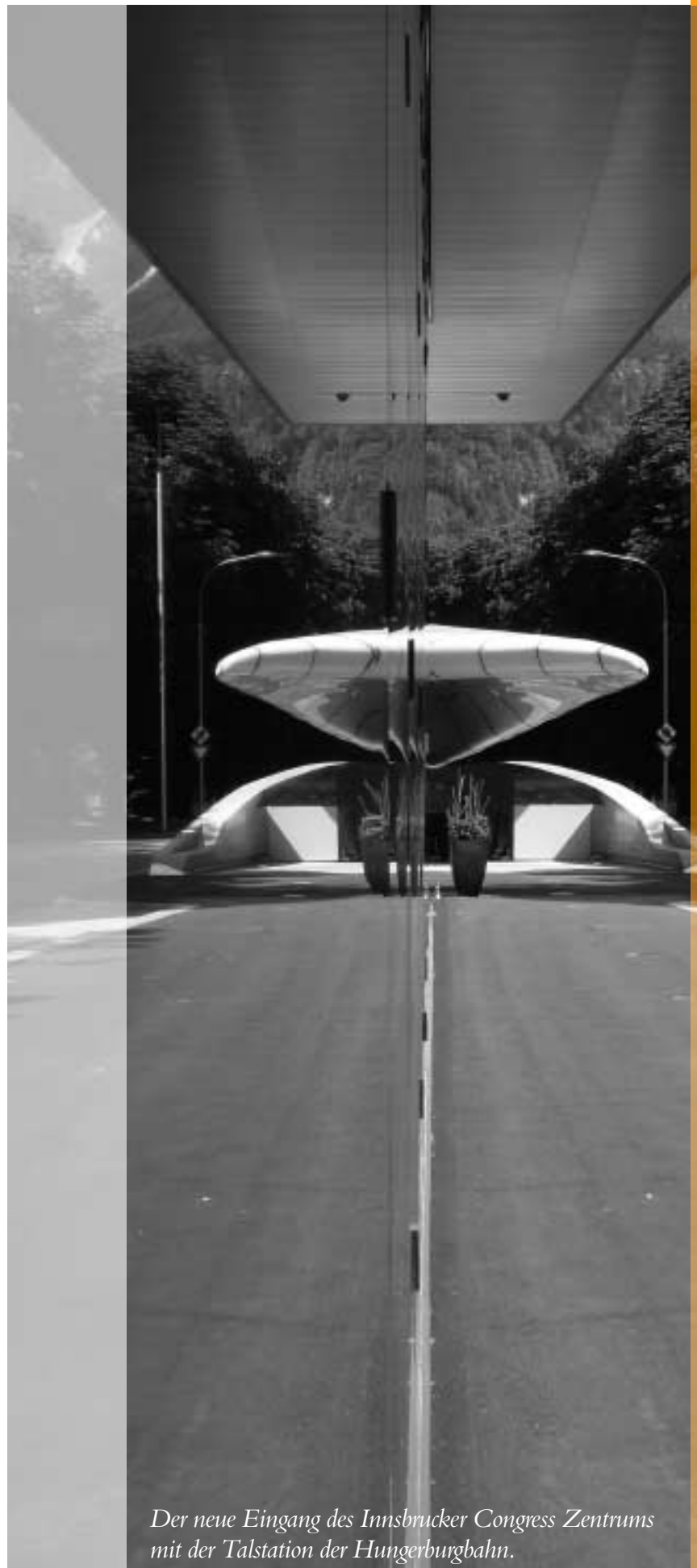
Der neue Eingang des Innsbrucker Congress Zentrums mit der Talstation der Hungerburgbahn.

Wer am nachfolgend aufgeführten Programm nicht teilnehmen will, der kann einfach einen luxuriösen Hotelaufenthalt genießen und erlebt einen wunderbar erholsamen Urlaub.