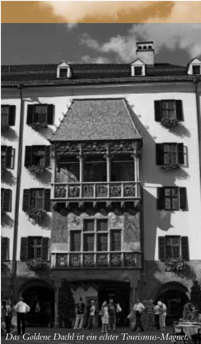
Das Goldene Dachl ist ein echter Tourismus-Magnet.

Ankunft gegen 16 Uhr. Zunächst werden die Zimmer verteilt, dann folgt eine gemütliche Kaffeepause. Um 19 Uhr gibt es Abendessen. Wer mag, kann dann den Abend entspannt ausklingen lassen oder ab 21 Uhr zu beschwingter Musik im Hotel tanzen.