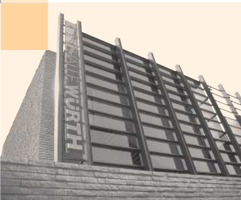
Die futuristische Kunsthalle lädt ein.

Derzeit findet in der Kunsthalle Würth eine Sonderausstellung mit Werken von Alfred Hrdlicka statt. Der Wiener Bildhauer, Maler, Zeichner und Grafiker wird aus Anlass seines 80. Geburtstags mit über 200 Werken seines vielfältigen und reichhaltigen Schaffens gewürdigt. Eine einstündige Führung soll uns mit dem Künstler und seinen Objekten bekannt machen.