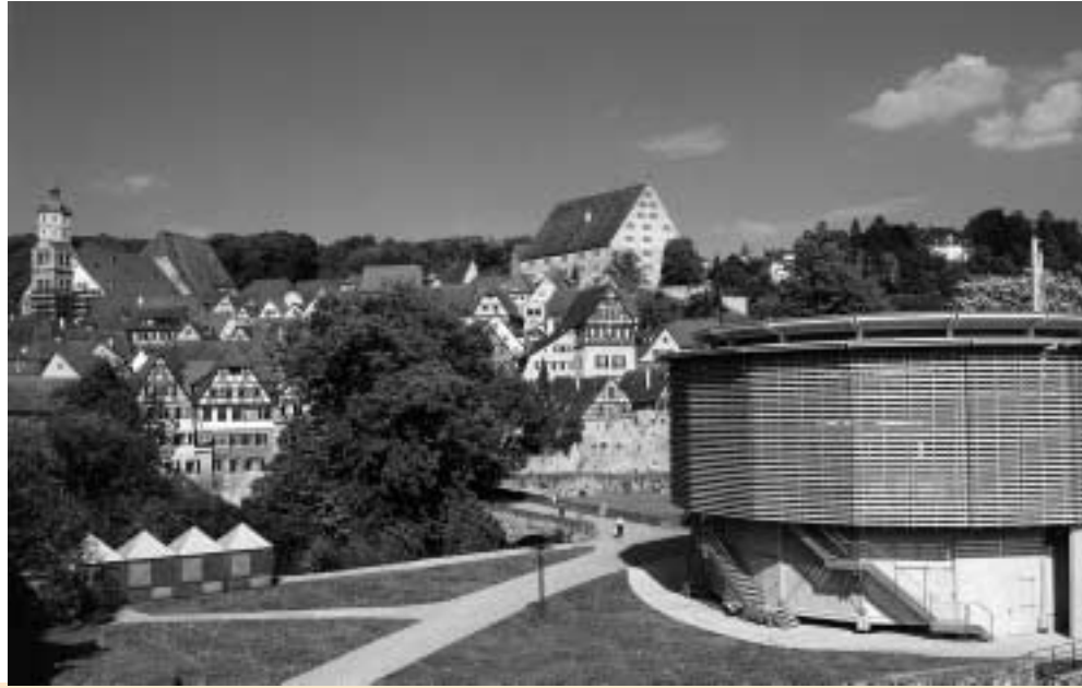
Ein Blick auf das nette Städtchen Schwäbisch Hall.

Aufführung im Globe Theater und Ausstellung in der Kunsthalle Würth