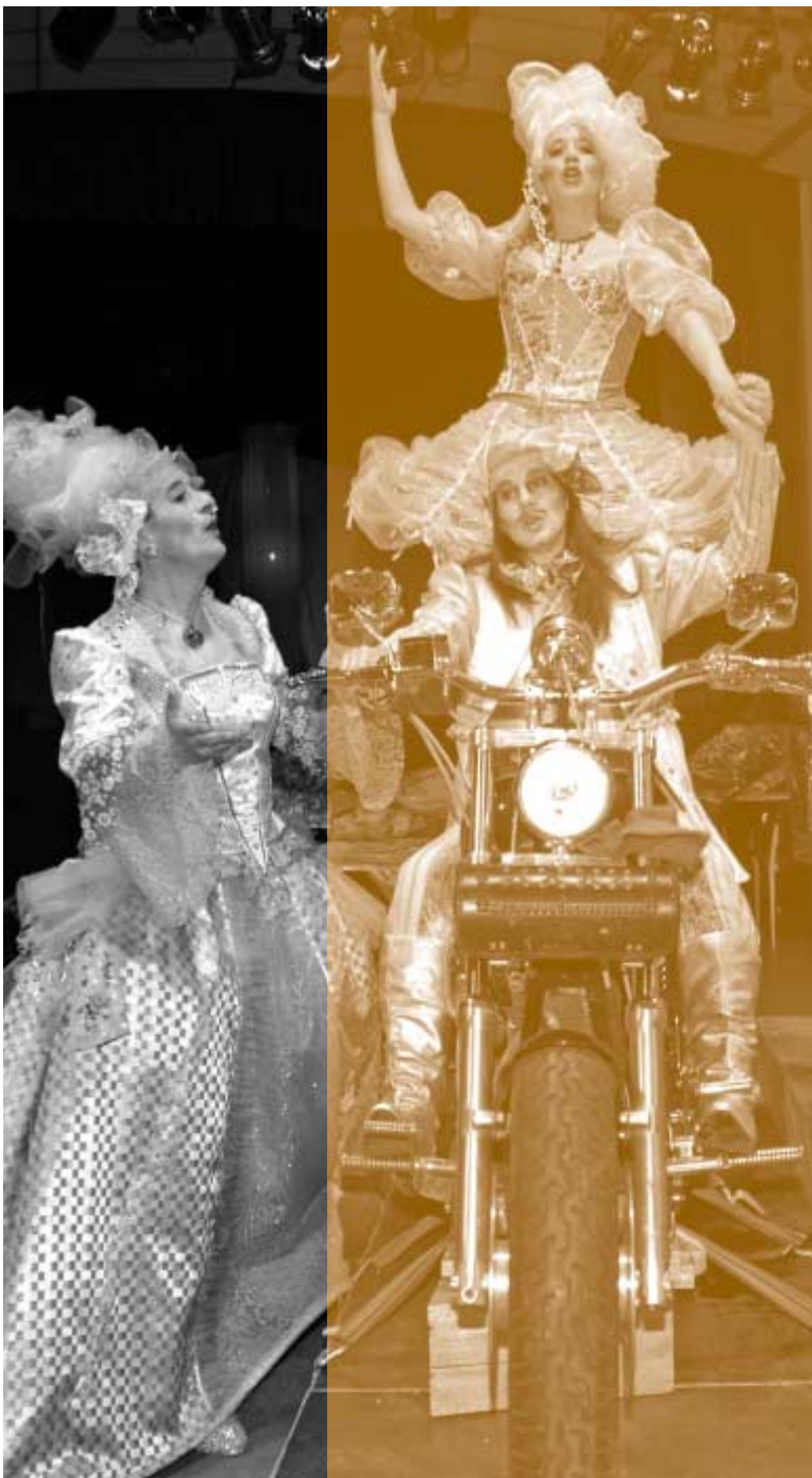
Unsere Bilder zeigen Impressionen der letzten Produktion „Love me tender“.

Ich habe das reizende Stück „Les amours de Ragonde“ von Jean Joseph Mouret, ein echtes Juwel aus dem 17. Jahrhundert, zufällig entdeckt und mich an die Nationalbibliothek in Paris gewandt, weil der Verlag keine Noten dazu hatte. So erhielt ich originale Handschriften des Komponisten und habe für jede Stimme einen eigenen Schlüssel geschrieben,