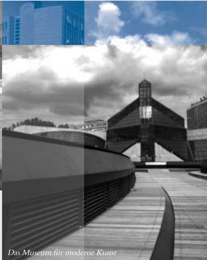
Das Museum für moderne Kunst