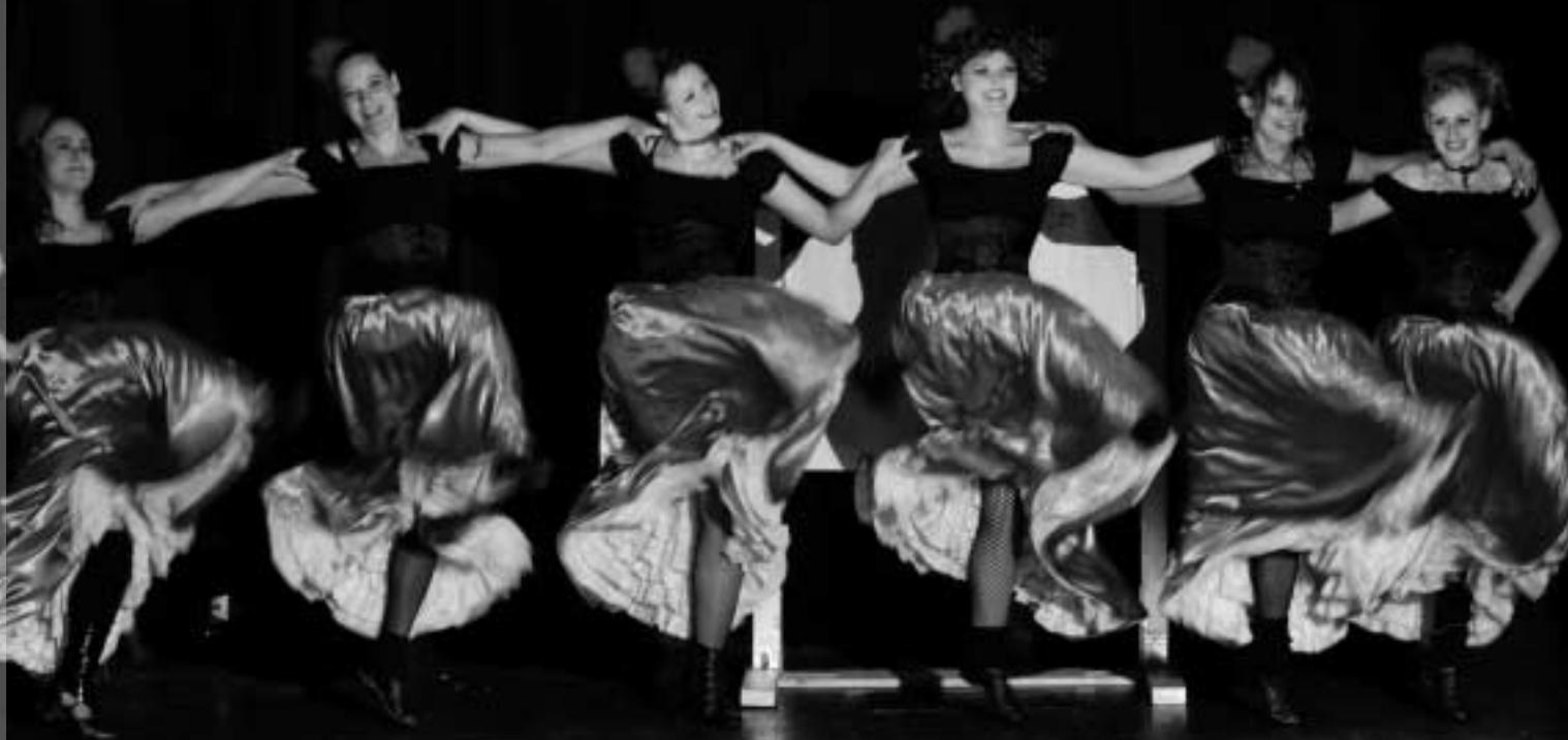
Der IKV lädt zum Frühlingsball