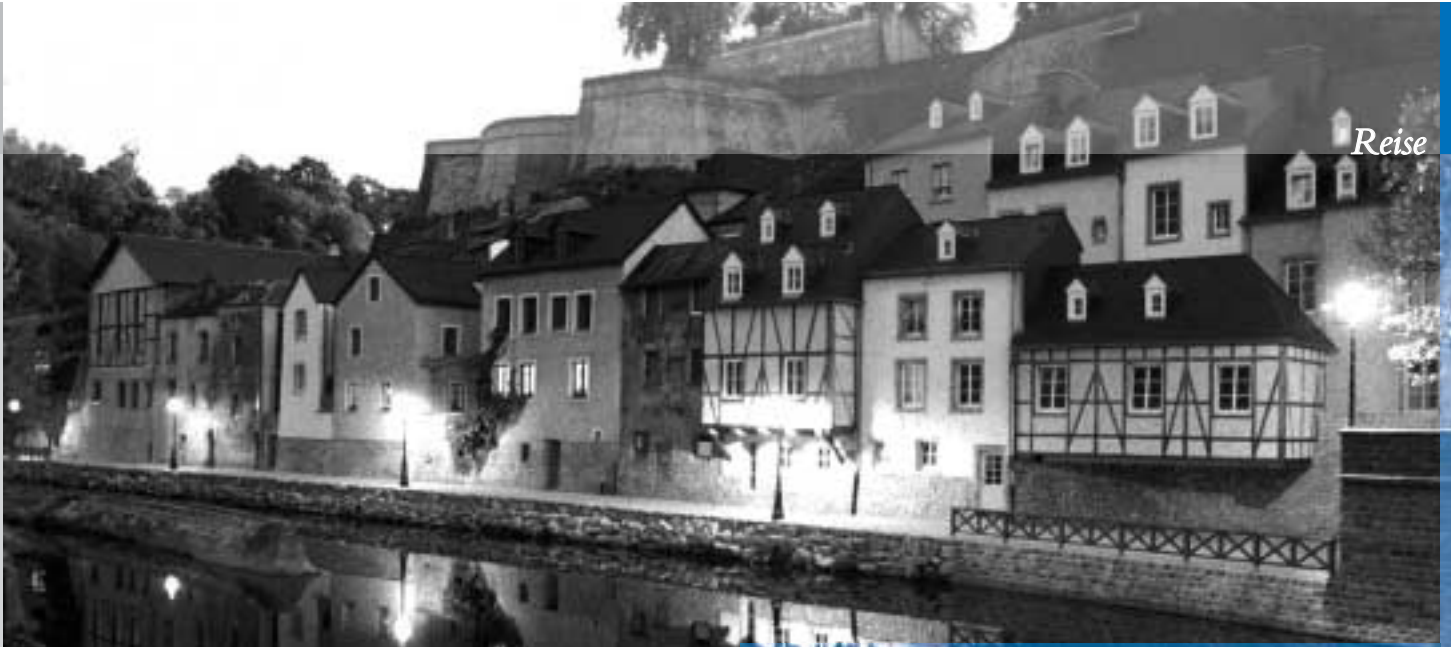
Die Corniche in der Altstadt