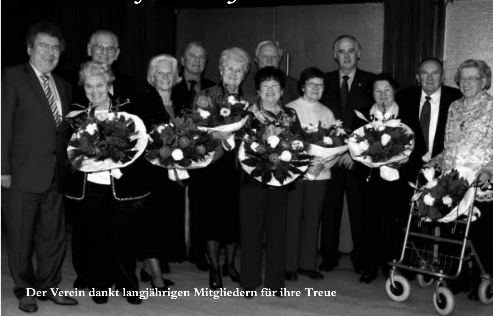
Der Verein dankt langjährigen Mitgliedern für ihre Treue