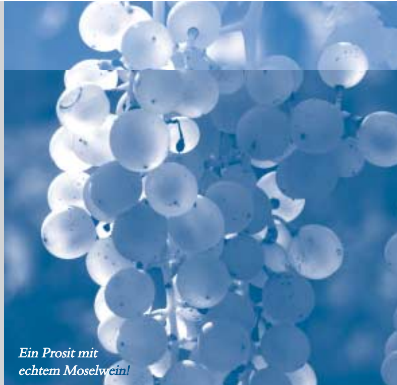
Ein Prosit mit echtem Moselwein!

Den Abschluss unseres Tagesausfluges bildet der Ort Bourglinster. Von bizarren Felsmassiven umgeben, säumen kleine, sandsteinfarbene Häuschen die kopfsteingepflasterten engen Straßen und Gassen. Mitten im Ort stehen auf einer felsigen Anhöhe die Burg und das Schloss Bourglinster mit den schiefergedeckten Rundtürmen und verschachtelten Bauten.