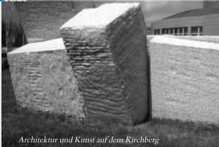
Architektur und Kunst auf dem Kirchberg