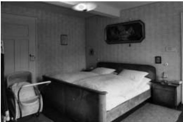
Ein Blick ins Laufer Industriemuseum

Natürlich war jeder Nürnberger schon einmal in Lauf. Aber mal ehrlich, wie viel weiß man wirklich über unsere liebenswerte kleine Nachbarstadt? Grund genug für den IKV, einen Tagesausflug anzubieten. Die Kreisstadt des Nürnberger Landes liegt östlich von der Noris im unteren Pegnitztal, dem Eingang zur Frankenalb. Hier fließt die Pegnitz noch durch eine fast unberührte Flusslandschaft. Sehenswert sind das historische Altstadtensemble, der Marktplatz und die Reste der Stadtbefestigung mit zwei mächtigen Stadttoren. In den Ortsteilen finden sich ehemalige Herrensitze und malerische Landschlösschen der fränkischen Patrizierfamilien und in Beerbach eine der schönsten gotischen Hallenkirchen Frankens, in der auch Konzerte veranstaltet werden.