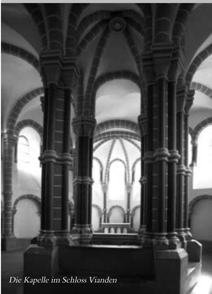
Die Kapelle im Schloss Vianden

Am Abend besuchen wir ein Festkonzert in der Luxemburger Philharmonie. Das Orchestre Philharmonique du Luxembourg spielt von Franz Schubert die „Overtüre aus Rosamunde“ und die „Symphonie Nr. 7“ sowie von Richard Strauß „Don Quixote“. Es dirigiert Emmanuel Krivine und der Solist am Violincello ist Gautier Capuçon. Die Karten sind in der 1. Kategorie.