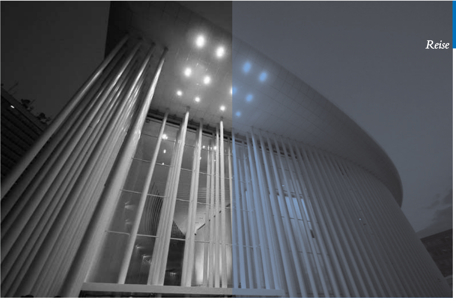
Die Philharmonie mit ihren Säulen.

Das Großherzogtum bietet auf Grund seiner kulturellen und historischen Vielfalt eine Reihe einzigartiger Sehenswürdigkeiten, die eine Reise auf jeden Fall lohnenswert machen. Trotz aller Geschäftigkeit und Gigantomanie ist Luxemburg ein kleines, verträumtes Land geblieben, ein Märchenreich zum Schauen und Staunen.