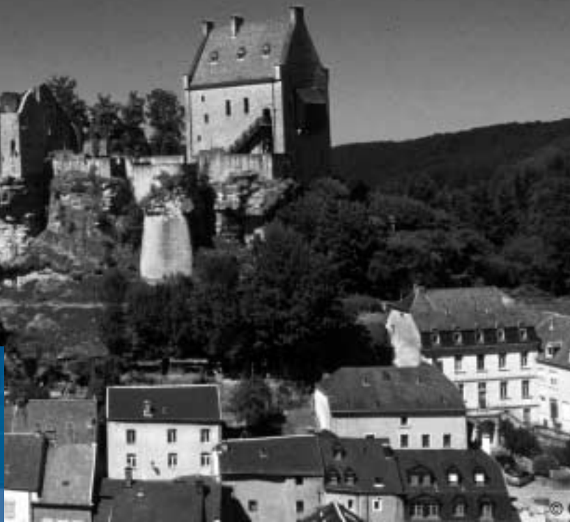
Die Burg Larochette.

Obwohl von der Fläche nicht sehr groß, ist Luxemburg kosmopolitisch und überrascht durch seine ethnische Vielfalt. Der Ausländeranteil ist auf Grund der europäischen Einrichtungen der Stadt sehr hoch und liegt derzeit bei ungefähr 62%. Wegen der weltoffenen Haltung ist Luxemburg Anziehungspunkt für Menschen aus allen Kulturen, die ihre Erfahrungen mitbringen, das Land prägen und so Tradition und Experiment verbinden. Die Sprachen sind Französisch, Deutsch und Letzebuergisch.