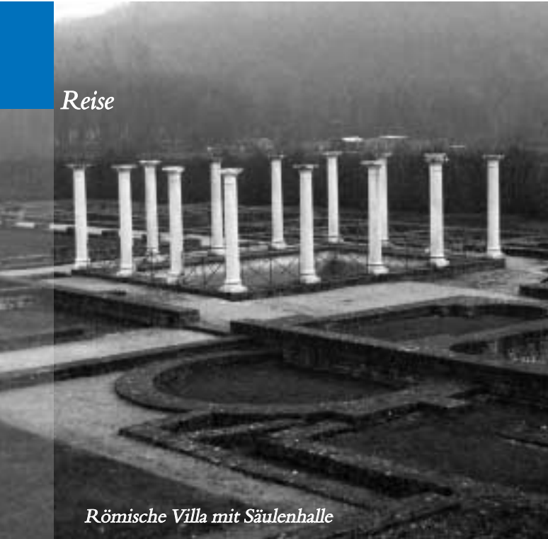
Römische Villa mit Säulenhalle